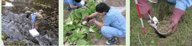
河川水の採取 農産物の採取 土壌の採取