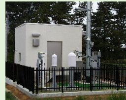
モニタリングポスト モニタリングステーション (空間放射線量率を連続測定)