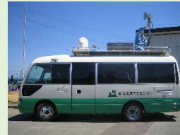
モニタリングカー (車を使った走行測定)