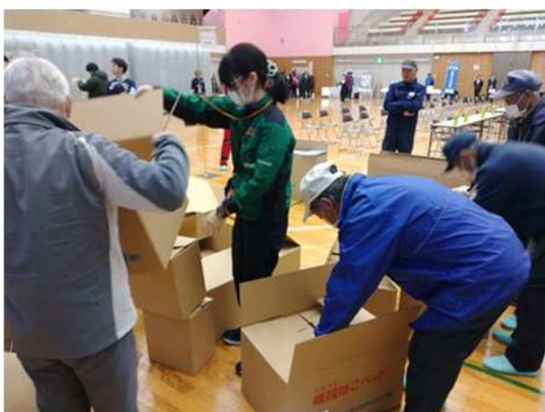
【段ボールベッド設営体験】