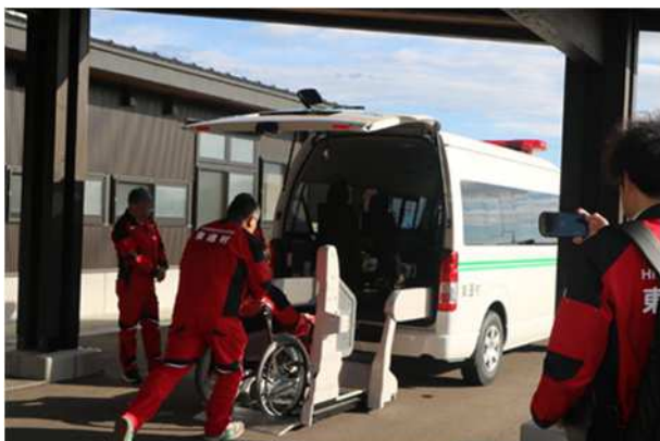
【一時集合場所からの要配慮者の搬送】