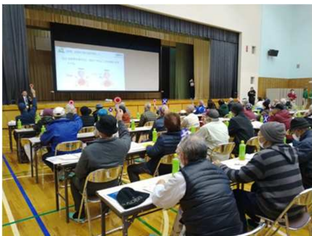
【原子力防災に係る〇×クイズ】