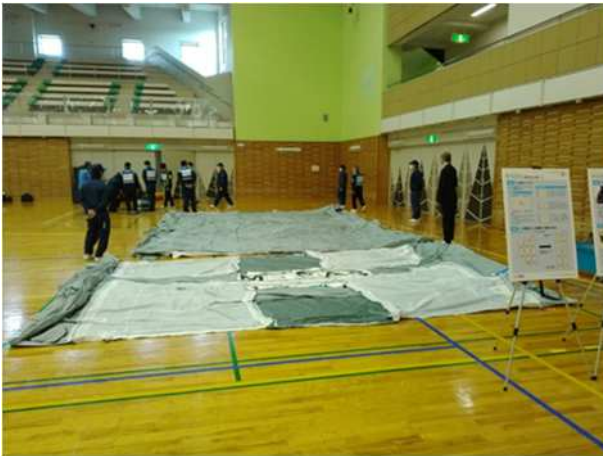
【可搬型エアテントの設営体験】