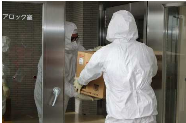
【エアロック室内への引き渡し】 (エアロック室ドアを境界に設定し、汚染管理)