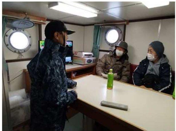
【海上自衛隊大型曳船の船内見学】