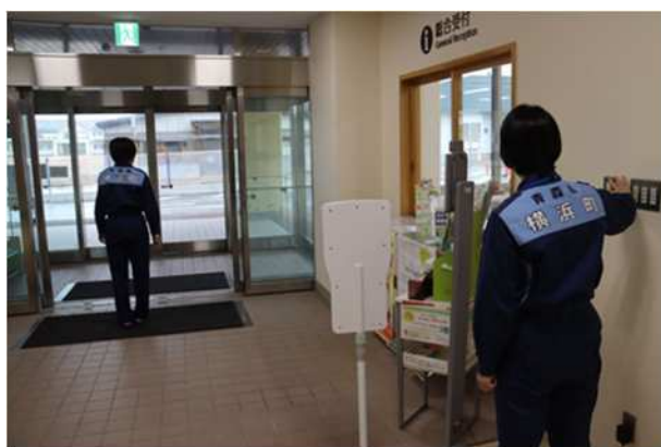
【自動ドア開閉設定の変更】