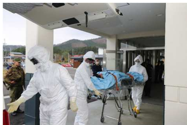
【傷病者（寝たきりの方）の搬送】