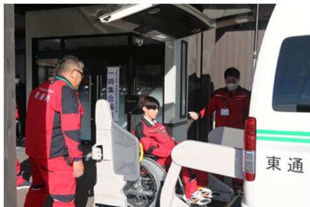
【要配慮者の乗車補助】