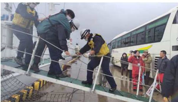
【青森海上保安部巡視船からの下船補助（車いす）】