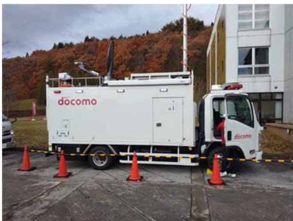
【移動基地局】 (NTT ドコモ ビジネスソリューションズ、ドコモ CS 東北)