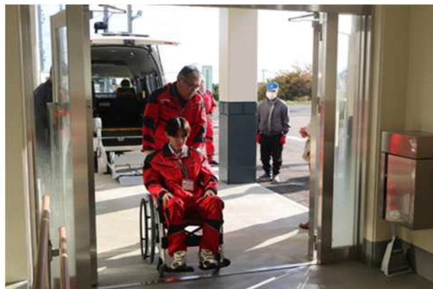
【放射線防護対策施設への受入（車いす）】