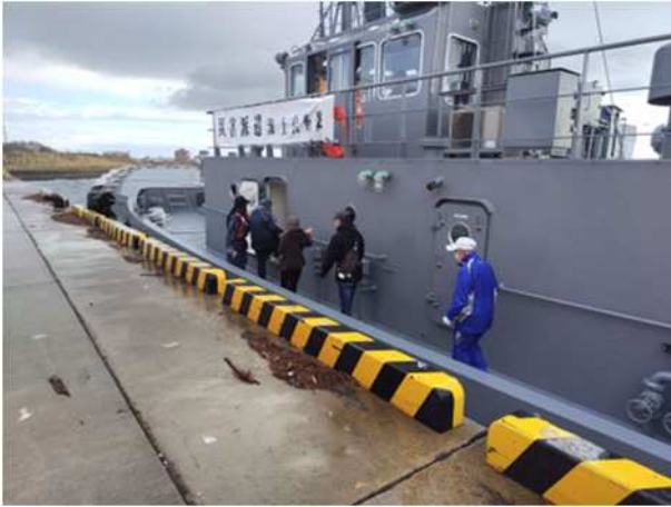
【海上自衛隊大型曳船への乗船】