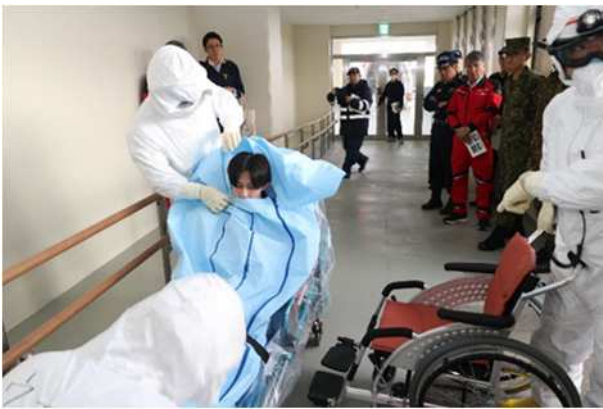
【傷病者への汚染防止対策の実施】