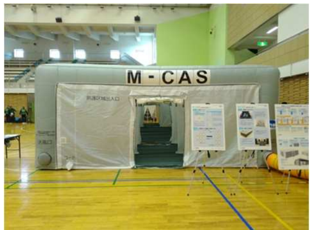
【可搬型エアテントの設営体験（展張）】