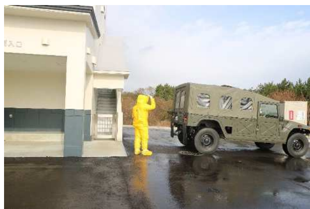
【物資搬送車両の誘導】