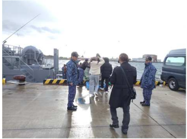
【海上自衛隊大型曳船への乗船】