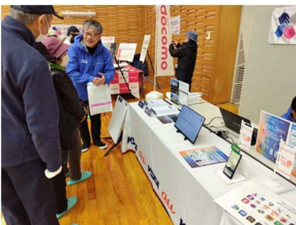
【避難所支援に係る展示】 (KDDI)