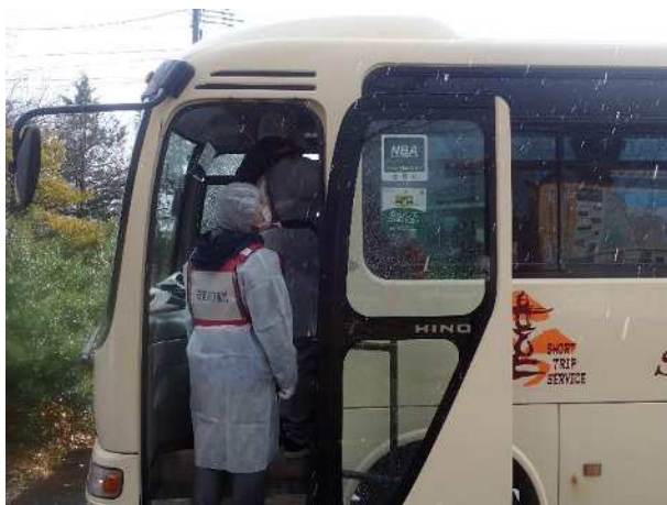
【バス乗客への安定ヨウ素剤配布】