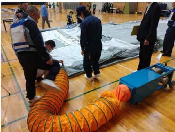
【可搬型エアテントの設営体験】