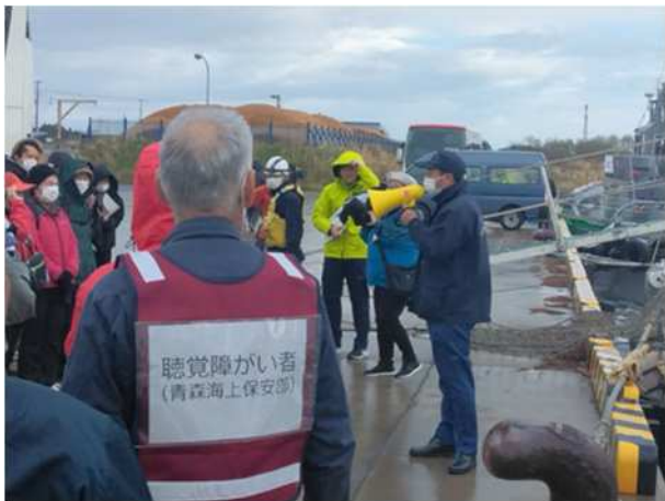
【青森海上保安部による乗船前の説明】