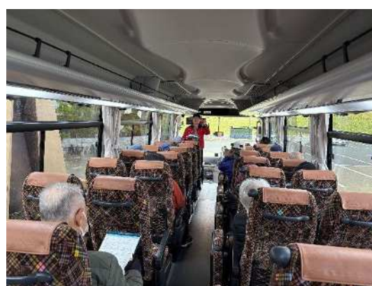
【バス内での安定ヨウ素剤配布・服用】