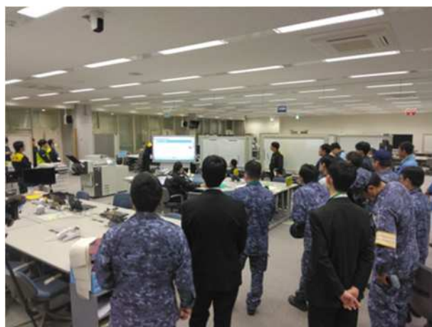
【施設敷地緊急事態発生に伴う機能班要員に対する研修】