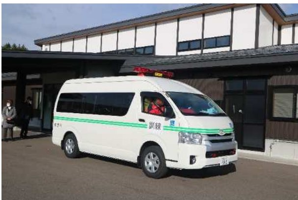
【福祉車両による搬送】