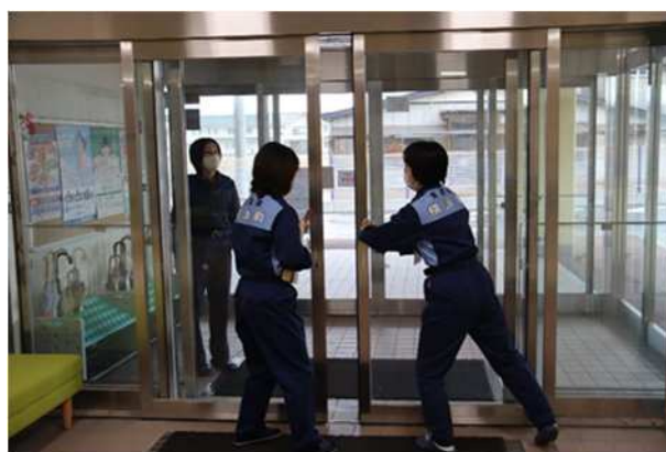
【手動でのドア開け閉め】