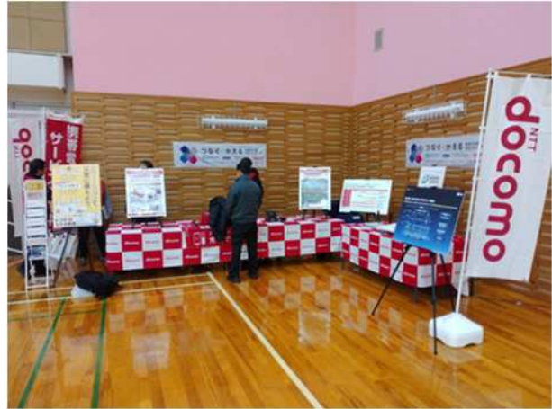
【避難所支援に係る展示】 (NTTドコモデジタルソリューションズ、ドコモCS東北)