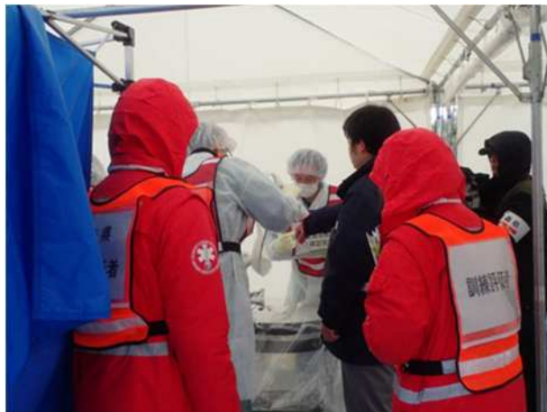
【住民簡易除染・確認検査】