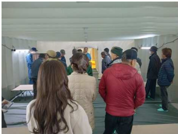
【可搬型エアテントの内部見学（居室）】