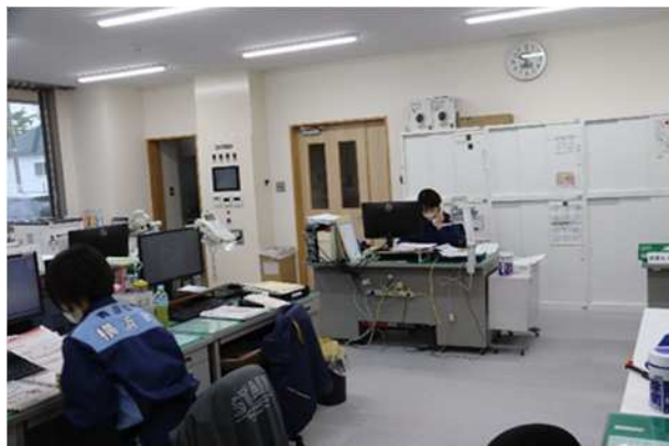
【放射線防護対策施設の稼働指示確認】