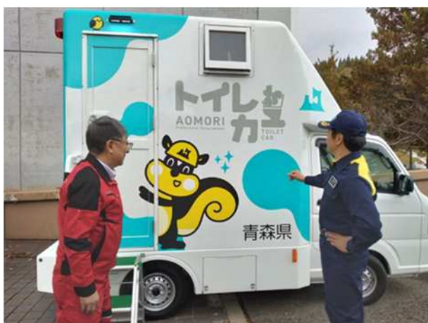
【トイレカーの展示】