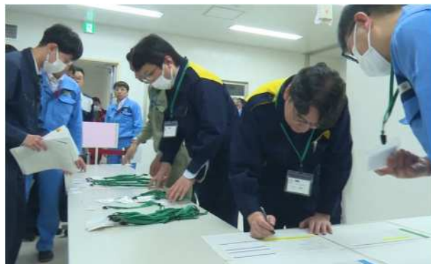
【オフサイトセンターへの入場方法に係る説明】