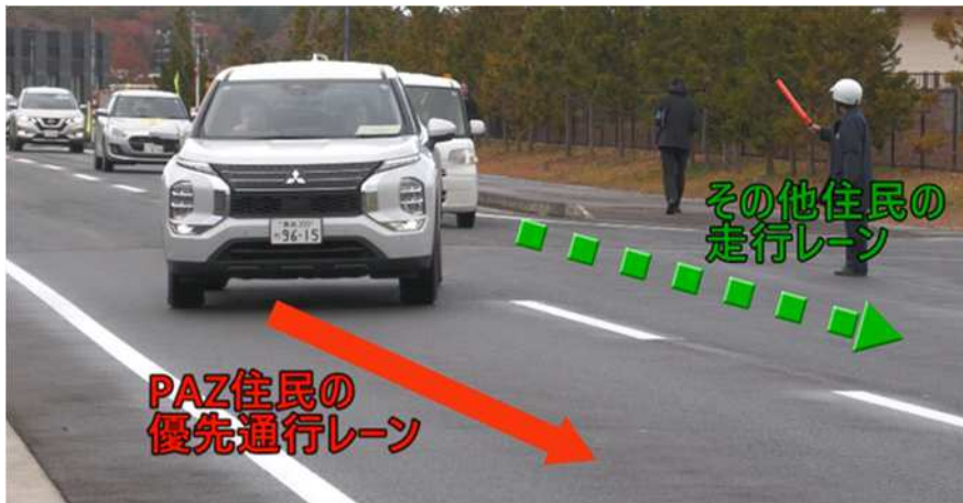
【避難車両の仕分け（PAZ、その他）】