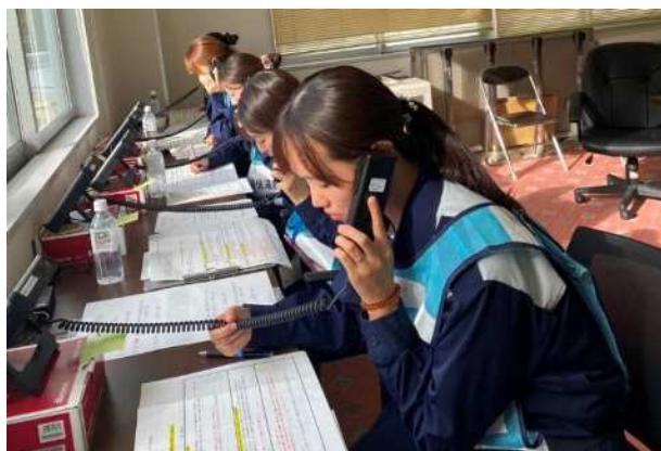
【衛星携帯電話での通信】