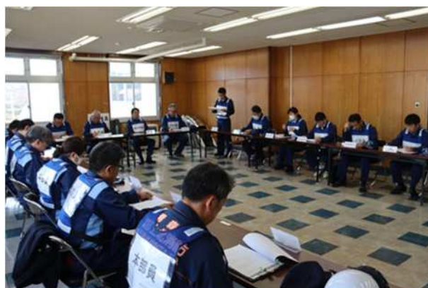
【町災害対策本部会議】