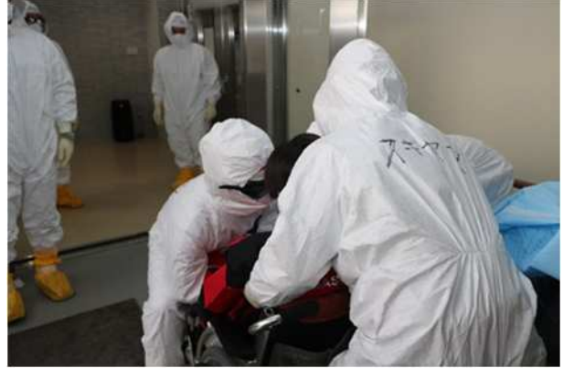
【傷病者（車いすの方）の載せ替え】