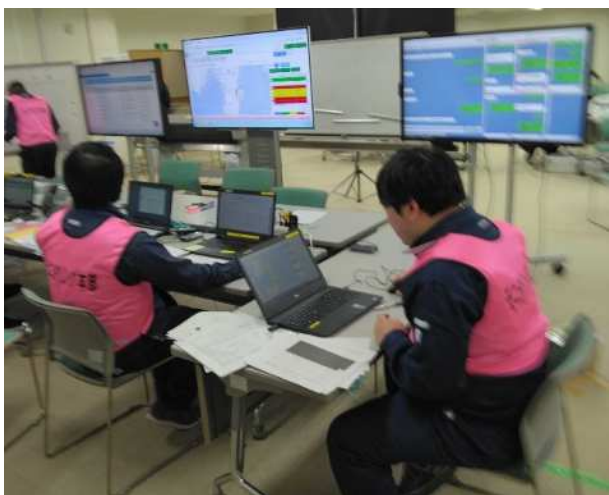
【モニタリング情報の収集、現場との調整】