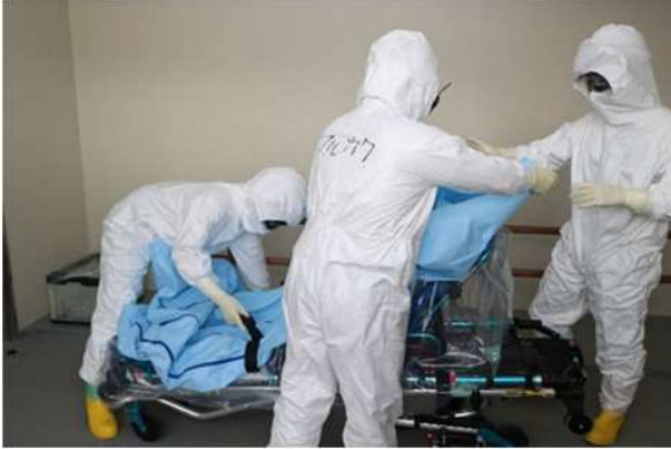
【ストレッチャーへの汚染防止シュラフ設置】