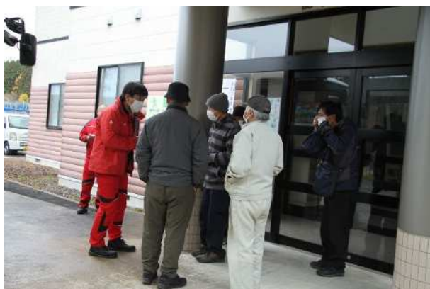
【避難住民の一時集合場所への集合】