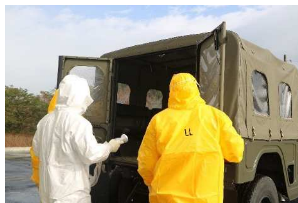
【東通村職員への物資の引き渡し】