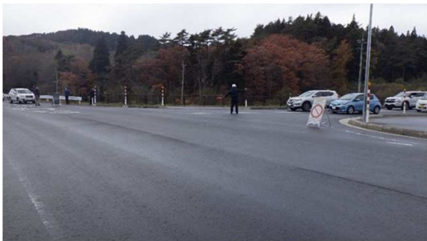
【村道と国道の合流地点における交通誘導】