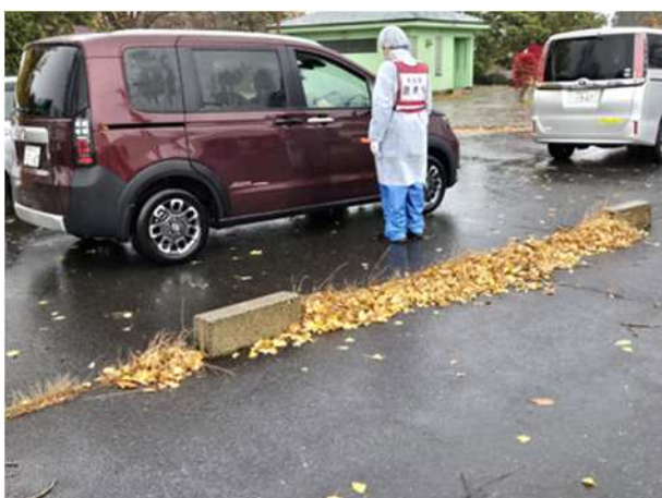
【汚染の有無の判定後の誘導】