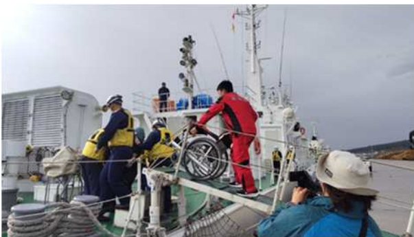
【青森海上保安部巡視船への乗船補助（車いす）】