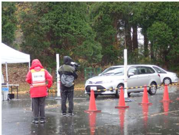
【車両指定箇所検査】