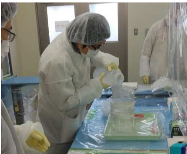
【採取試料の前処理】