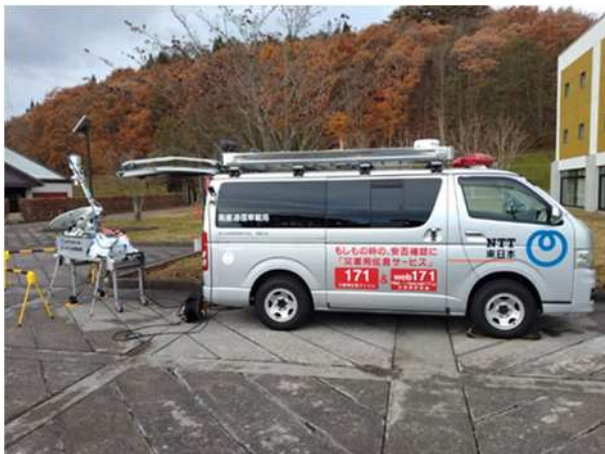
【衛星通信車載局】 (NTT 東日本)