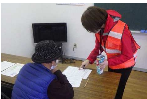
【安定ヨウ素剤配布・服用】