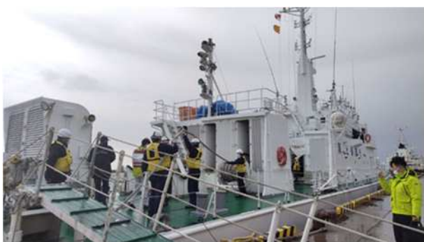
【青森海上保安部巡視船への乗船補助（視覚障がい者）】