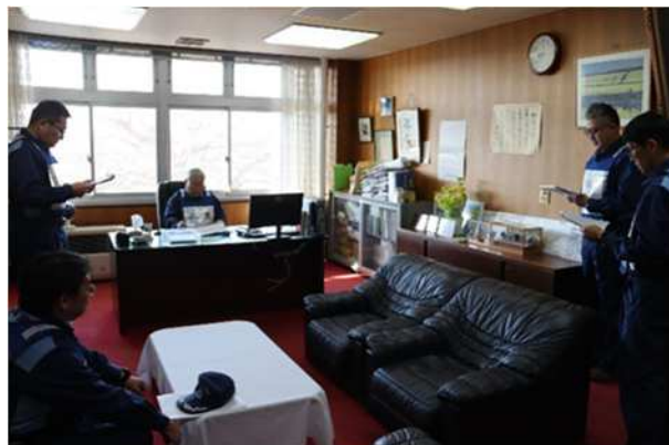
【原子力災害発生報告】