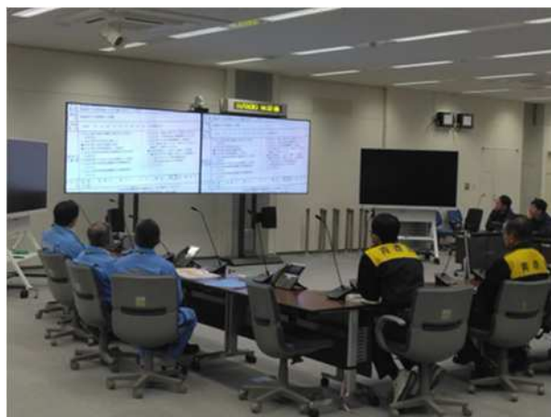
【オフサイトセンター機能班要員に対する研修】