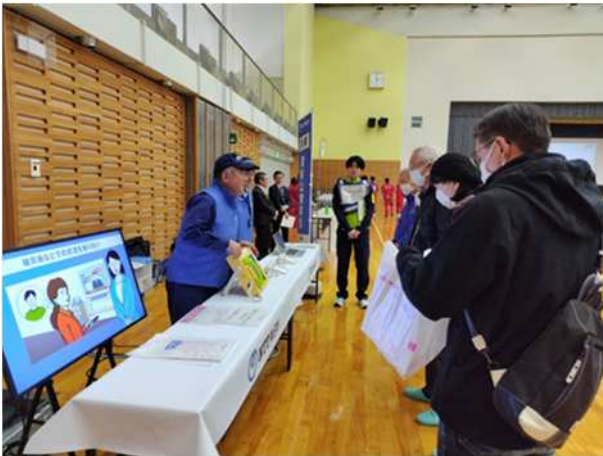
【臨時公衆電話に係る展示】 (NTT 東日本)