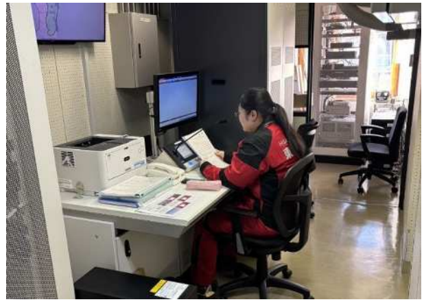
【防災行政用無線による広報】