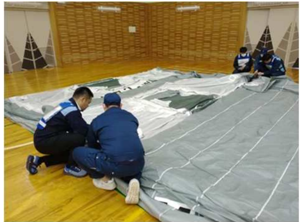
【可搬型エアテントの設営体験】