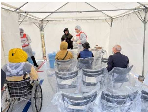
【住民指定箇所検査】