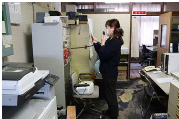
【原子力災害発生庁舎内アナウンス】