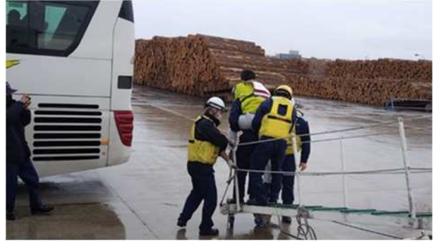
【巡視船からの下船補助（視覚障がい者）】