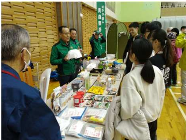
【防災グッズの展示】