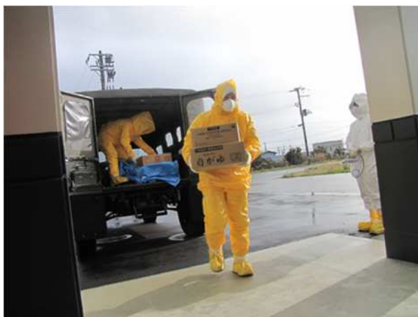
【物資の開梱、施設内への運搬】