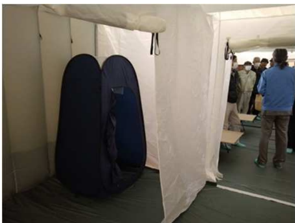
【可搬型エアテントの内部見学（トイレ）】