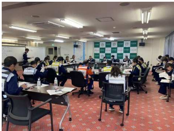
【災害対策本部会議】