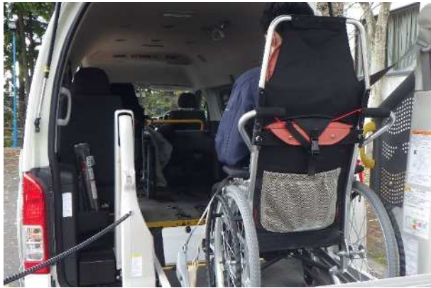
【要支援者 原子力福祉車両乗車】