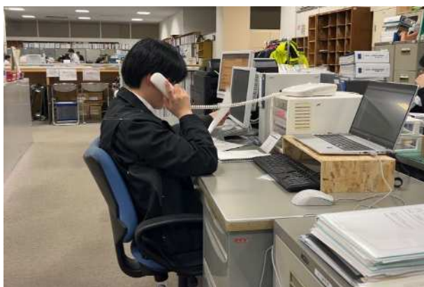
【電話による情報収集】