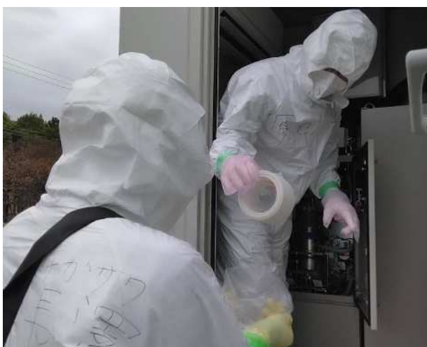
【大気モニタからのろ紙回収】