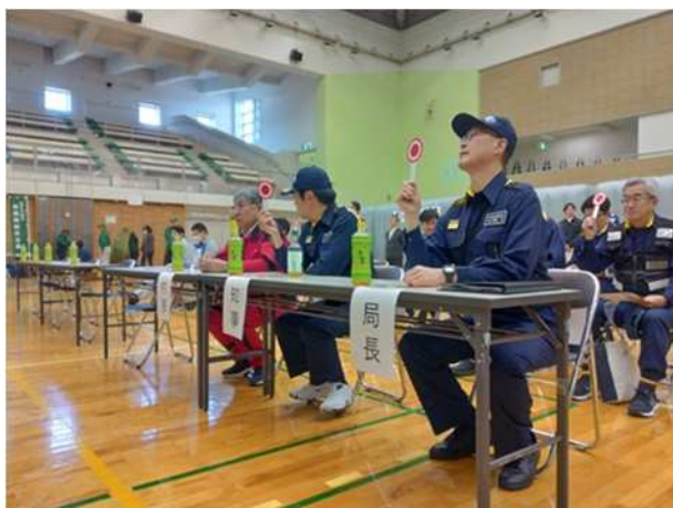
【原子力防災に係る〇×クイズ】