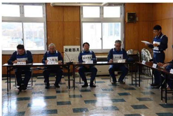
【町災害対策本部会議】