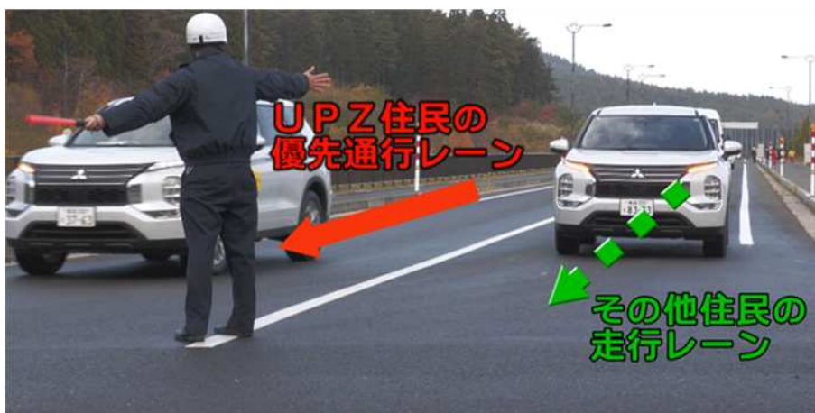
【村道と国道の合流地点における交通誘導】