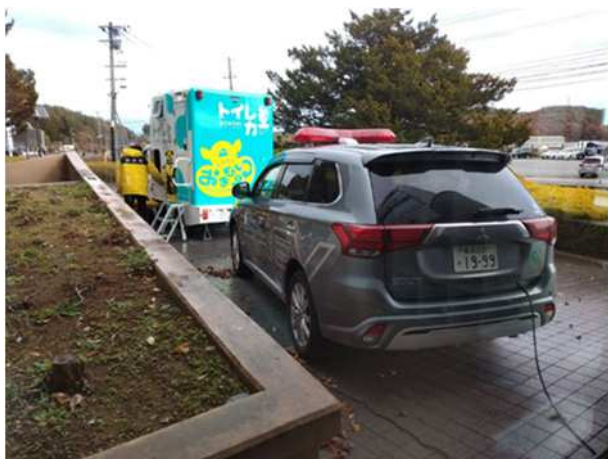
【県公用車から可搬型エアテントへの給電】