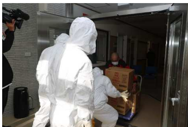
【施設内への物資搬入】