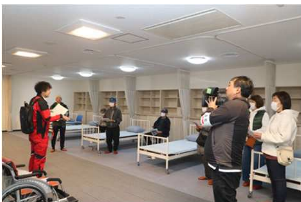
【放射線防護対策施設開設手順等の説明】