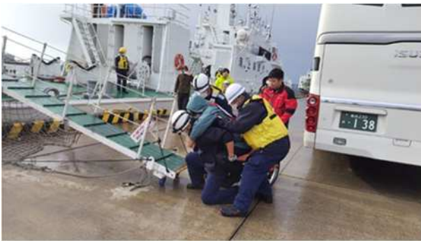
【青森海上保安部巡視船への乗船補助（車いす）】