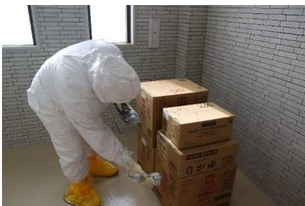
【物資の表面汚染濃度測定（詳細測定）】