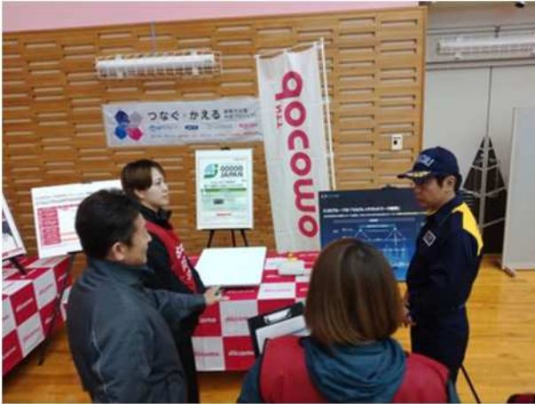
【スターリンクへの接続体験】 (NTTドコモデジタルソリューションズ、ドコモCS東北)