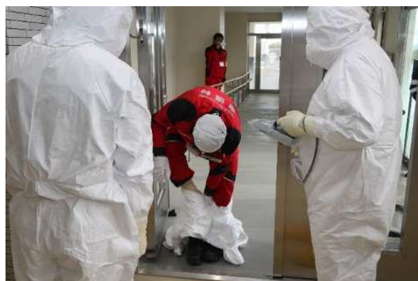
【東通村職員の防護装備の脱装（物資受入後）】