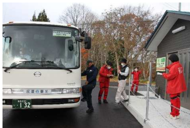
【バスによる住民避難】