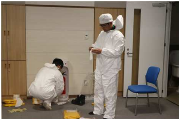
【東通村職員（放射線防護対策施設の運営要員）の防護装備の着装】