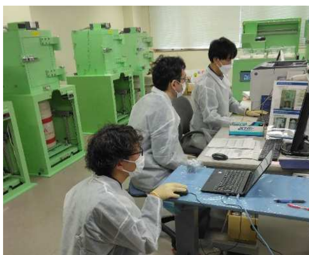
【採取試料の測定・解析】