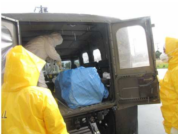
【物資の表面汚染濃度測定（簡易測定）】