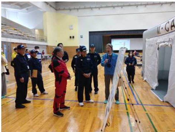
【可搬型エアテントの概要説明】