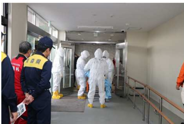
【施設内へのストレッチャーの搬入】