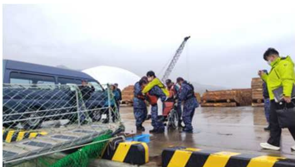
【海上自衛隊大型曳船からの下船補助（車いす）】