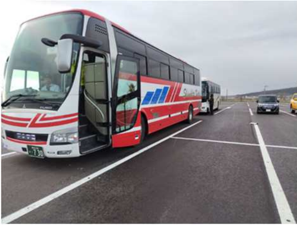
【住民搬送用のバス（むつ市用、東通村用）】