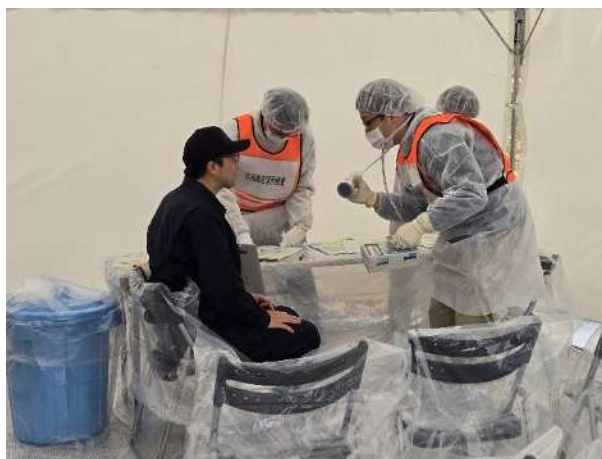
【住民指定箇所検査】