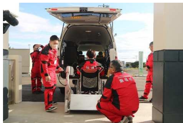
【福祉車両からの降車】