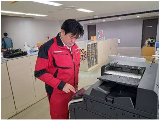
【FAXによる関係機関への連絡】