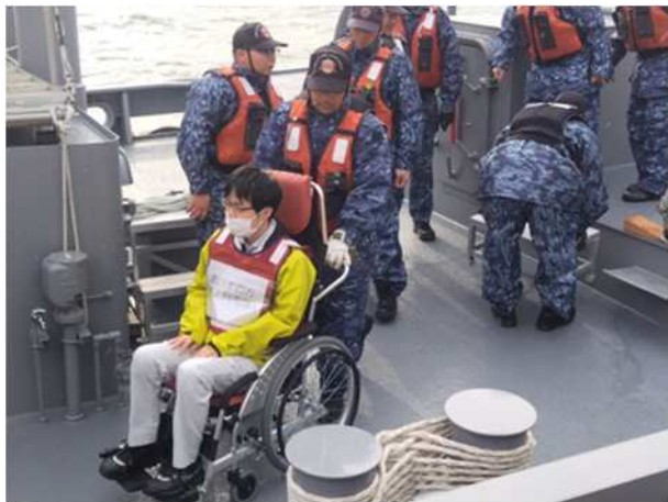
【海上自衛隊大型曳船への乗船補助（車いす）】