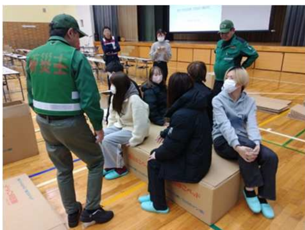
【段ボールベッド設営体験】