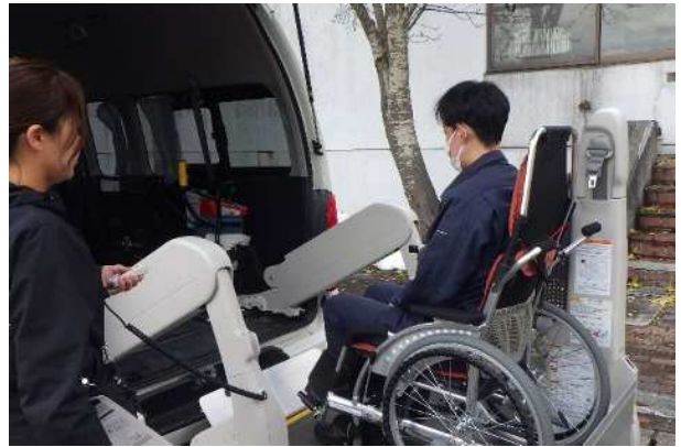
【要支援者 原子力福祉車両降車】