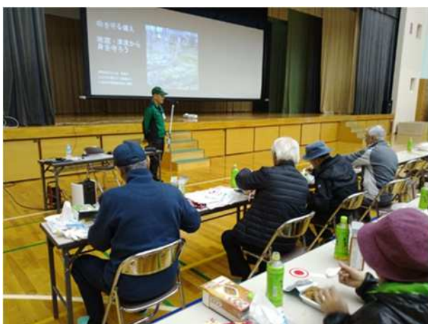
【防災士会による防災講話】