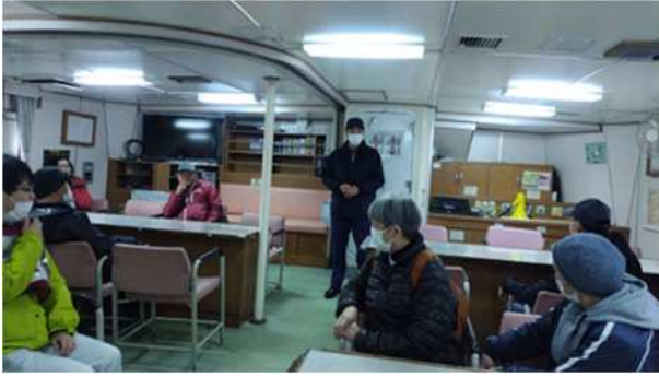
【青森海上保安部巡視船の船内見学】