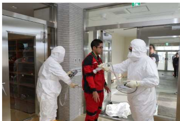
【東通村職員の身体汚染測定（物資受入後）】