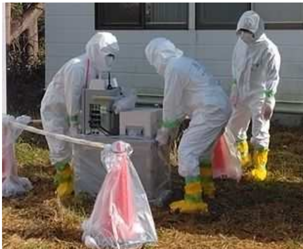
【可搬型モニタリングポスト設置】