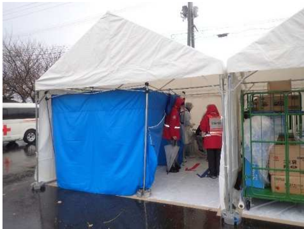
【住民簡易除染・確認検査】