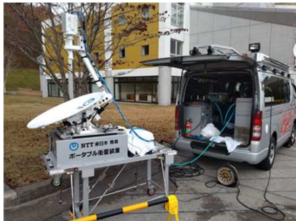
【ポータブル衛星装置】 (NTT 東日本)