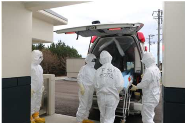
【ストレッチャーの準備】