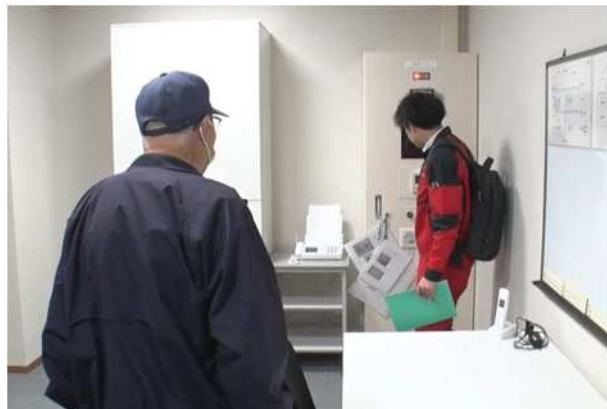
【陽圧化装置等の操作方法の説明】