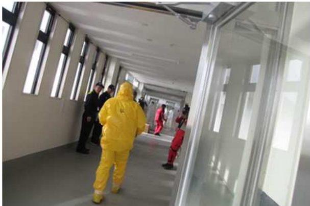
【風除室内（防護区画外）の運搬】