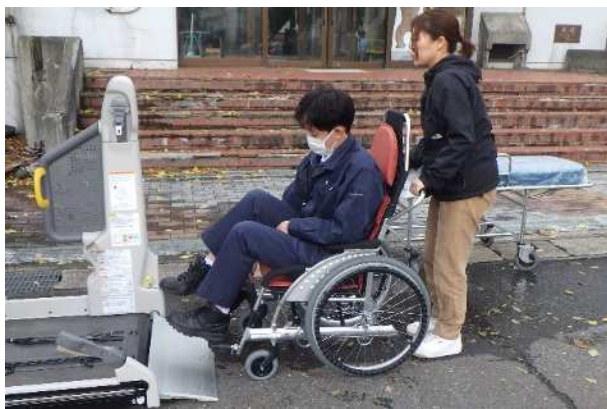
【要支援者 原子力福祉車両降車】