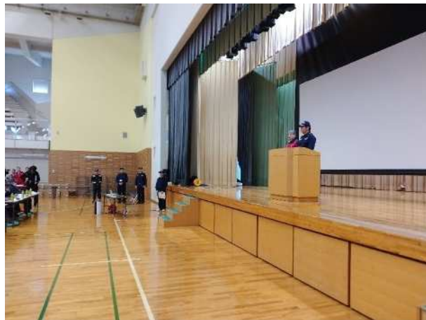
【東通村体育館にて講評】