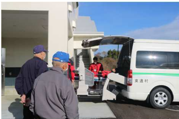
【放射線防護対策施設への受入（ストレッチャー）】