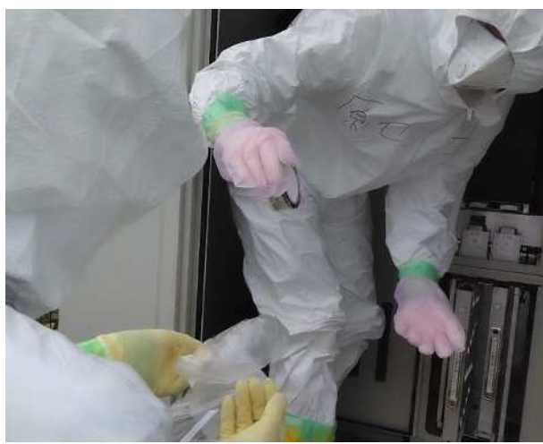
【ヨウ素サンプラからのカートリッジ回収】