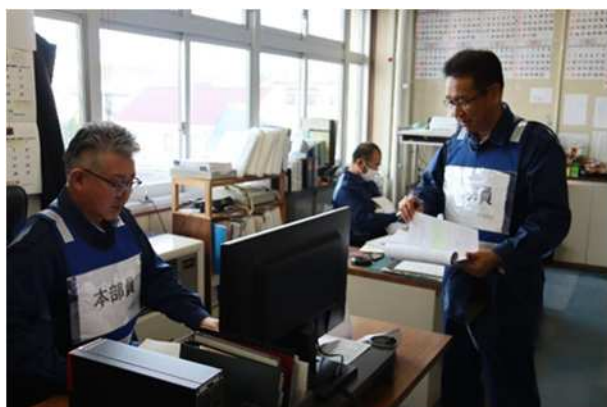
【各部署対応内容報告】