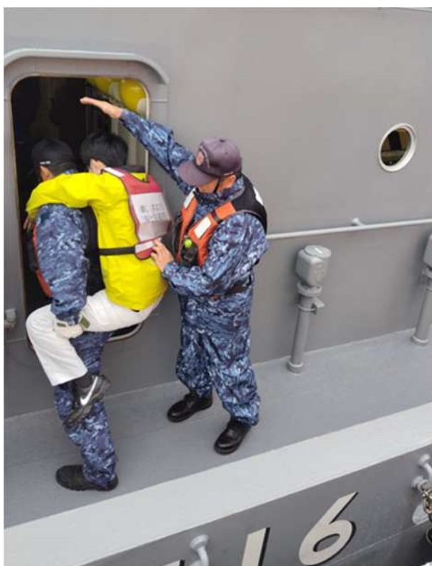
【海上自衛隊大型曳船への乗船補助（車いす）】

（車いす通行の妨げとなる障害物があったため、途中から要配慮者を背負って船内に搬送）