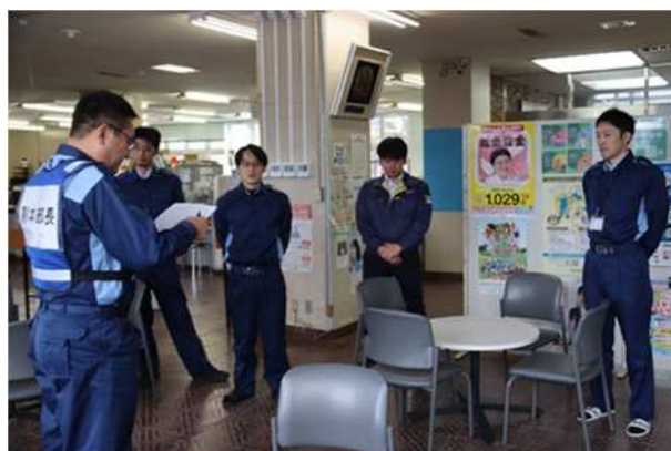
【オフサイトセンター派遣要員出発点呼】