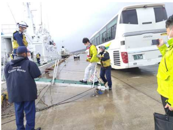
【青森海上保安部巡視船への乗船補助（視覚障がい者）】