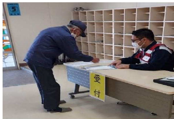
【避難所での住民受付】