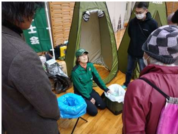
【簡易トイレ模擬体験】