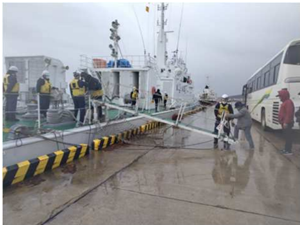
【青森海上保安部巡視船への乗船】