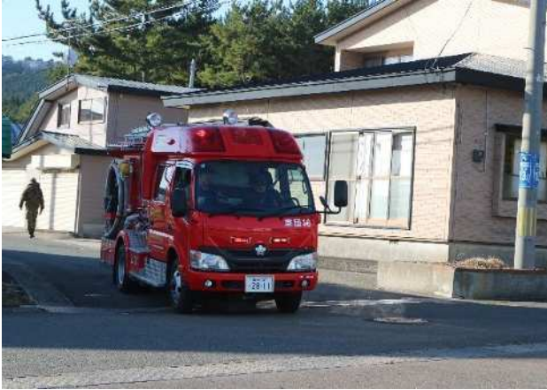
【車両による巡回広報】