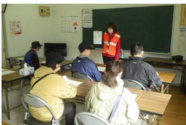
【安定ヨウ素剤配布・服用】