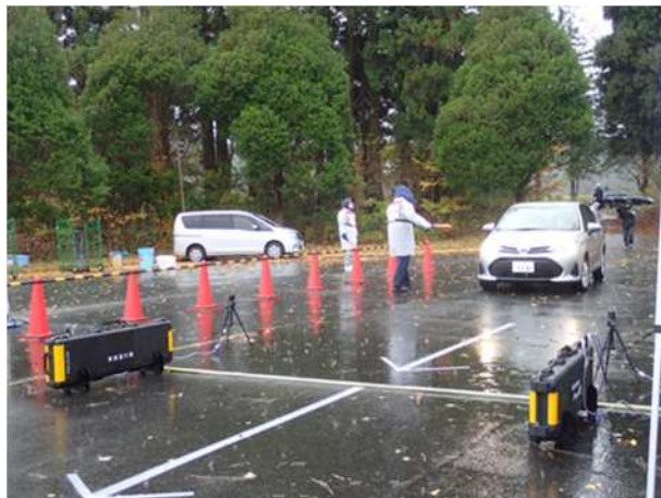
【車両指定箇所検査】