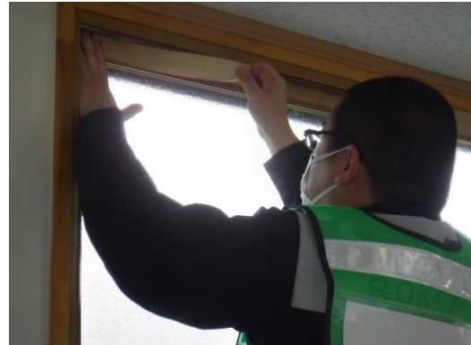
【屋内退避準備（窓の目張り）】