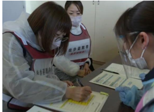
【専用ブースでの感染症疑い者対応】