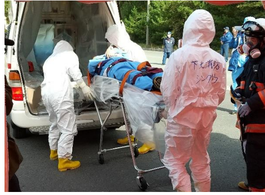
【交通事故傷病者対応】 (医療機関への搬送)