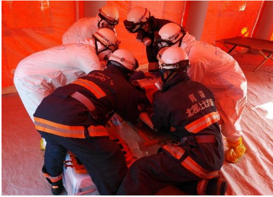
【交通事故傷病者対応】 (引継所での傷病者引継)