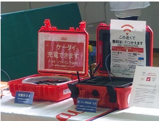
【Wi-Fi アクセスポイント等の設置状況】