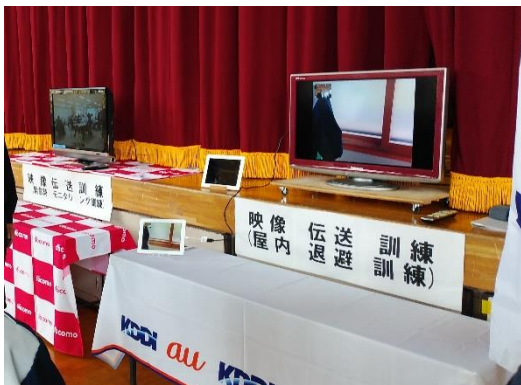
【リアルタイムでの映像伝送】