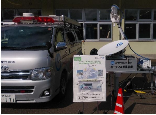
【ポータブル衛星装置と専用車両】