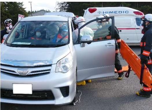
【交通事故傷病者対応】 （車両からの救出）