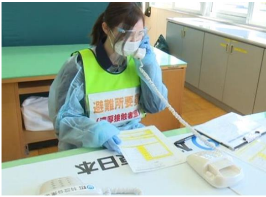
【臨時公衆電話を用いた情報伝達】