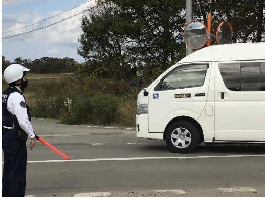
【警察による車両誘導】