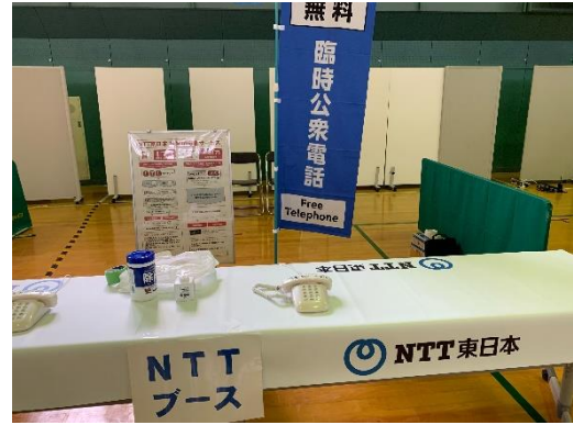
【臨時公衆電話設置状況】