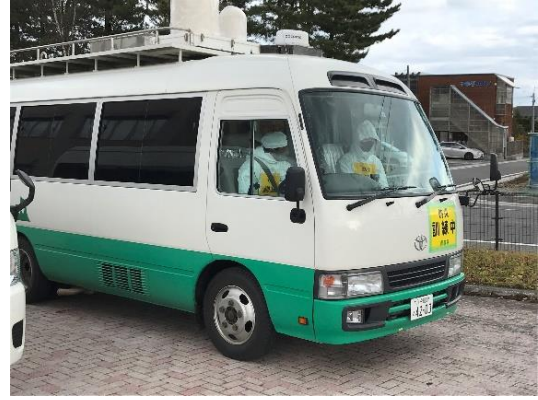
【モニタリングカー出動】