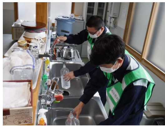
【屋内退避準備（飲料水の備蓄）】