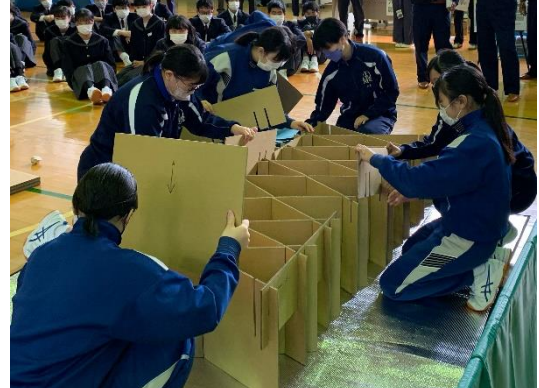
【第二中生徒による避難所体験】