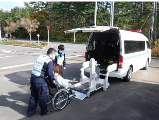
【村福祉車両への搭乗】