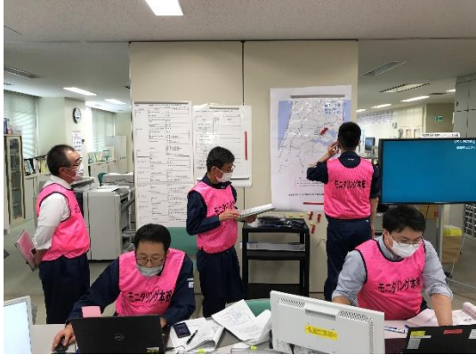
【モニタリング本部総括・連絡班】