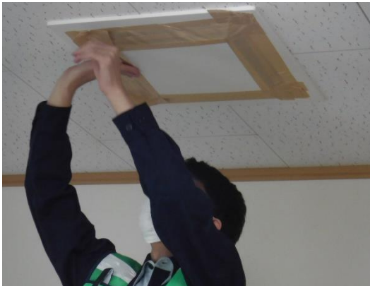
【屋内退避準備（換気扇閉鎖）】