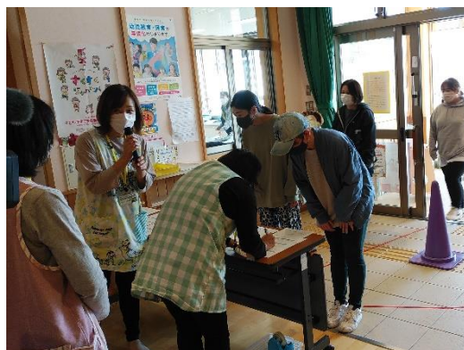
【保護者への園児引渡し】