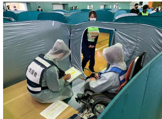
【居住スペースの状況】