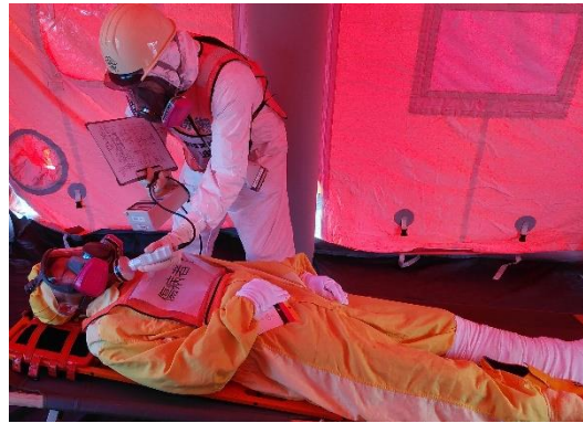
【汚染傷病者対応】 (引継所での汚染検査)