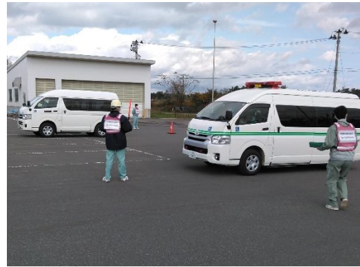
【避難退域時検査場所(模擬)】