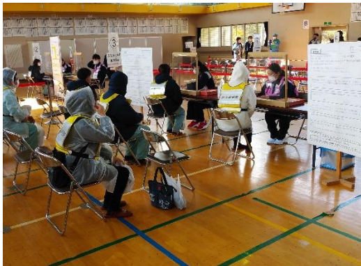
【安定ヨウ素剤配布ブースの状況】