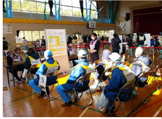
【受付ブースの状況】