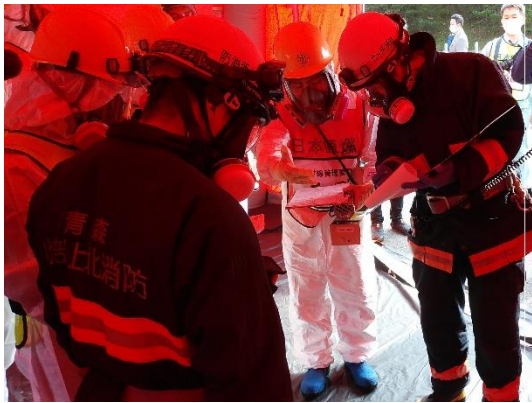
【汚染傷病者対応】 (引継所での傷病者引継)