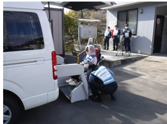
【福祉タクシーへの搭乗】