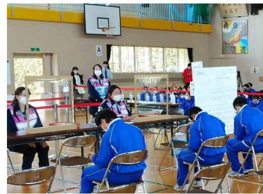
【第一中生徒による一時集合場所体験】