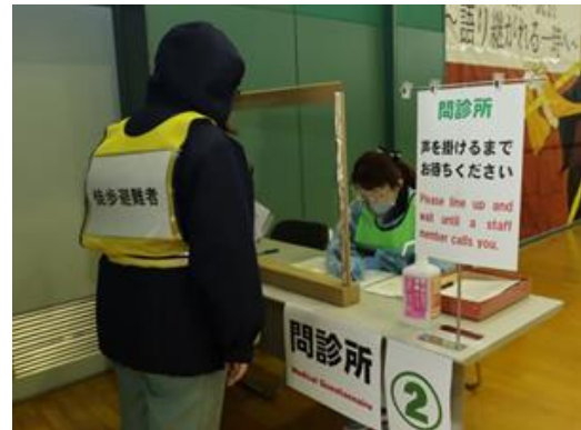
【問診ブースの状況】