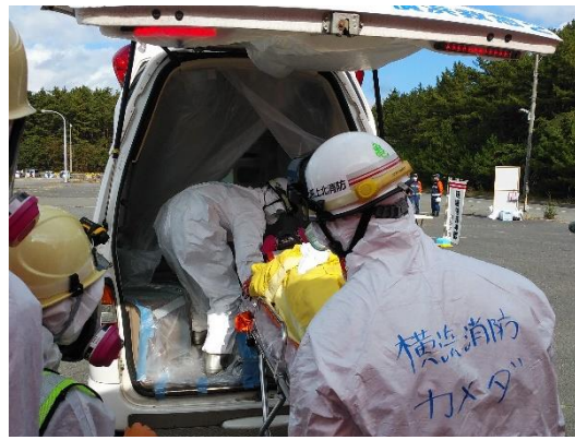
【汚染傷病者対応】 (医療機関への搬送)