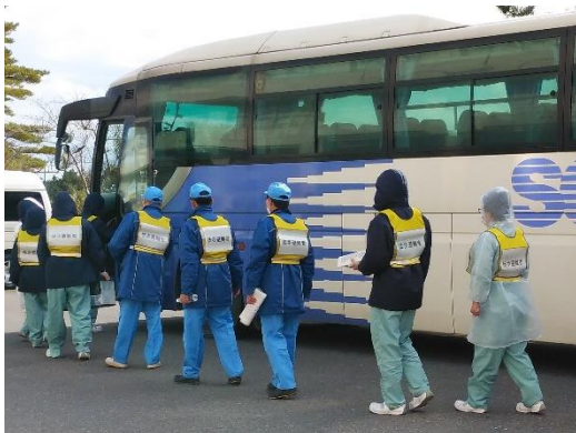
【バスによる住民避難】