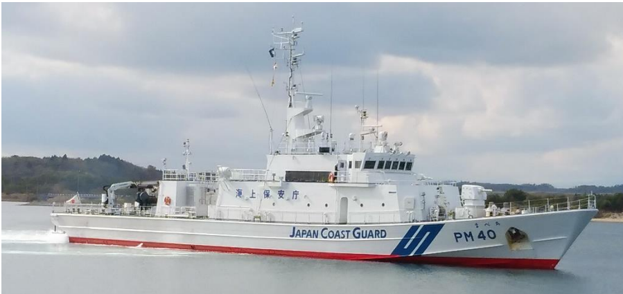
【巡視船「まべち」による広報】