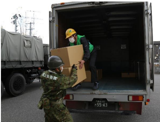
【集積所での物資積込】