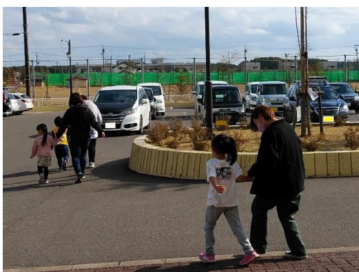
【保護者への園児引渡し】