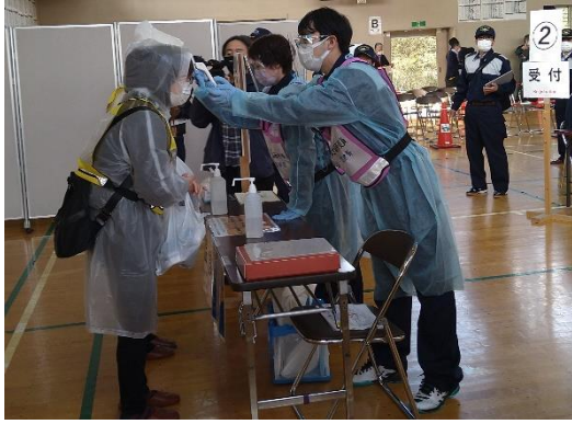
【避難者の検温・問診】