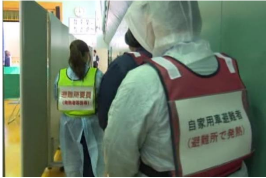
【感染症疑い者への対応】 (専用エリアへの誘導)