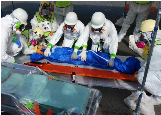
【汚染傷病者対応】 (消防現着～搬送)