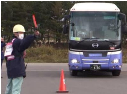
【避難退域時検査場所(模擬)】