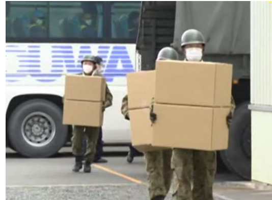
【避難所への物資搬入】