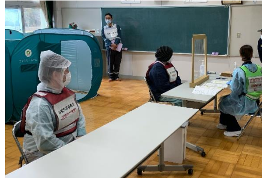
【感染症疑い者への対応】 (感染症疑い者用別室での受付対応)