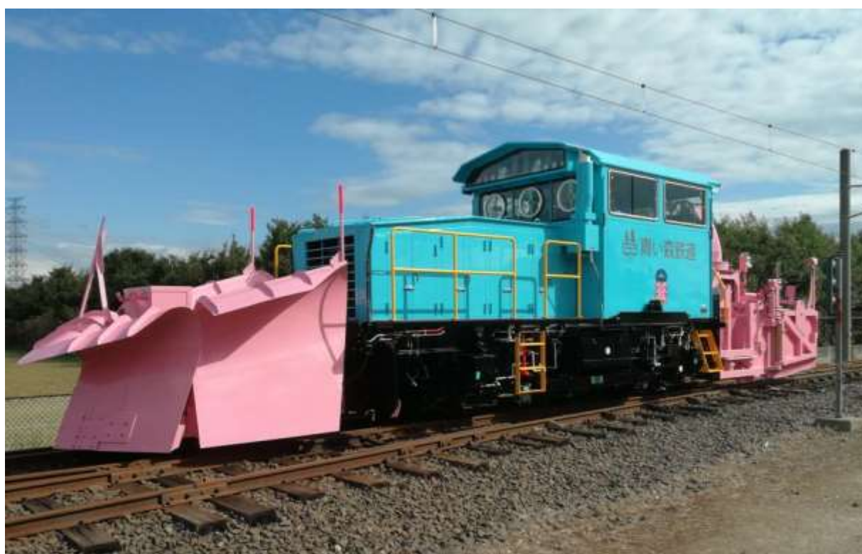
新型ロータリー除雪車（平成29年12月使用開始）