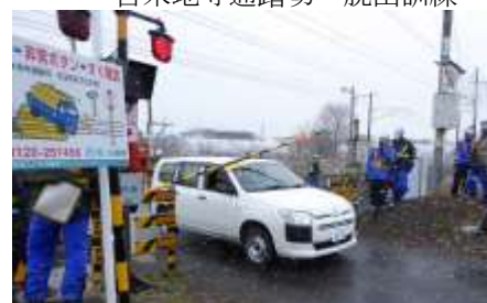
苫米地寺通踏切・脱出訓練

県、地元自治体、警察、交通事業者、青い森鉄道(株)のほか、一般利用者の安全に対する意識向上のため、町内の住民の方々が参加し、しゃ断かんが降下して自動車踏切内に閉じこめられた状態からの脱出訓練と非常ボタンによる列車停止手配訓練等を行いました。