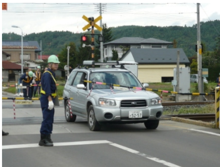
踏切事故防止訓練（平成 22 年 10 月 6 日）