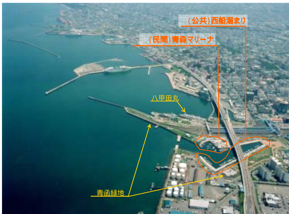
(公共)西船溜り～(民間)青森マリーナ