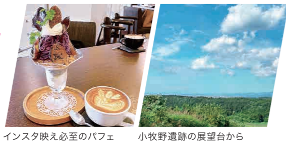
インスタ映え必至のパフェ 小牧野遺跡の展望台から

遠出して青森に帰ってくると、なぜかスッキリした気持ちになります。食べ物はおいしいし、ワーケーションにもふさわしく、囲まれた自然の中で心を浄化させることができる絶好の場所。隙間時間に洋画を、休日は飼い猫と過ごしてリフレッシュ!