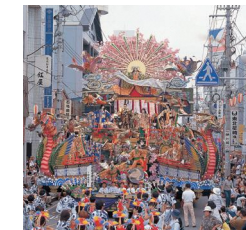
豪華絢爛な山車で世界無形文化遺産のひとつに登録された「八戸三社大祭の山車行事」