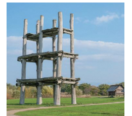
「北海道・北東北の縄文遺跡群」として世界文化遺産の登録をめざす三内丸山遺跡