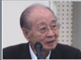
元国連事務次長 明石 康