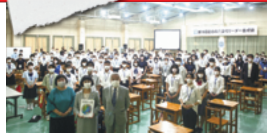
▲全国から高校生が参加する。