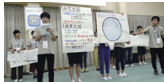
▲高校生の視点と発想で、今後の日本と世界の在るべき姿を描く。