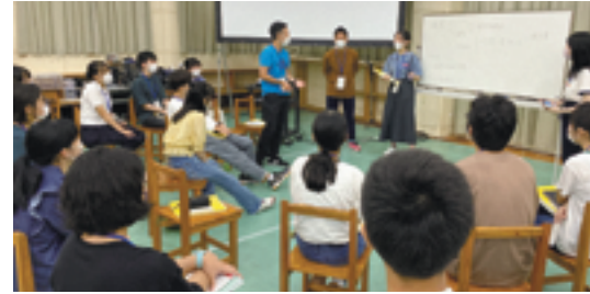
▲仲間たちとの熱いディスカッション。