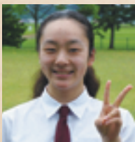
第18期生 青森県立八戸高等学校 1年