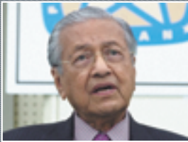
マレーシア第4代・7代首相 マハティール・ビン・モハマド