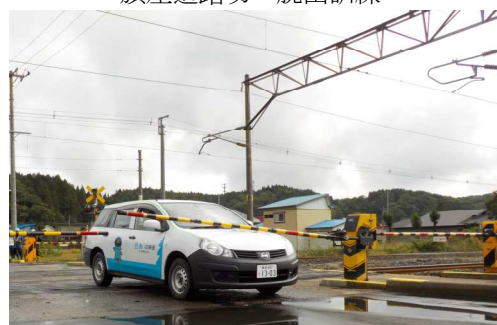
旗屋道踏切・脱出訓練

県、地元自治体、警察、交通事業者、青い森鉄道(株)のほか、一般利用者の安全に対する意識向上のため、町内の住民の方々が参加し、しゃ断かんが降下して自動車踏切内に閉じこめられた状態からの脱出訓練と非常ボタンによる列車停止手配訓練等を行いました。