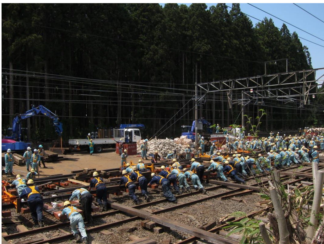
シーサスクロッシング全交換（野辺地駅構内）