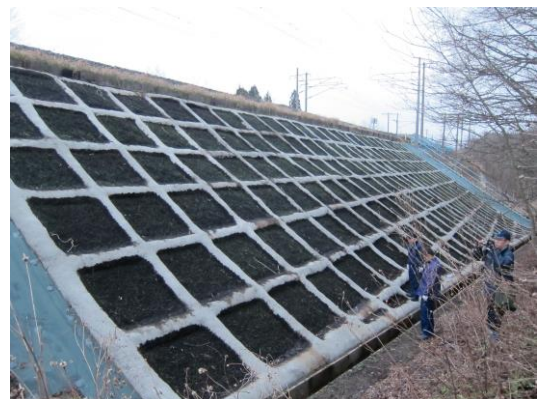
鉄道施設保守作業（のり面新設）