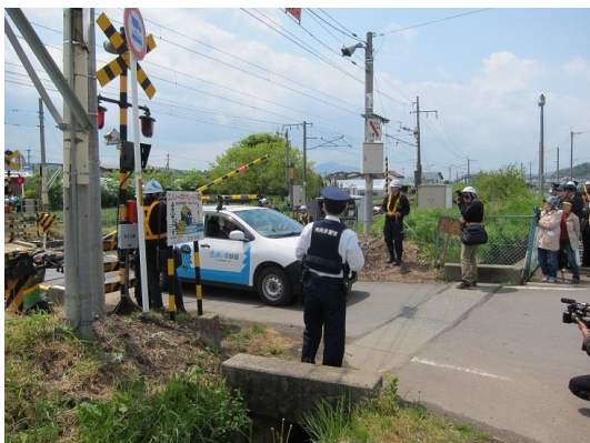
踏切事故防止訓練会（脱出訓練）

日本貨物鉄道(株)東北支社が主催した訓練に参加し、東青森駅を会場に、機関車脱線の復旧等について訓練しました。（平成27年9月9日）