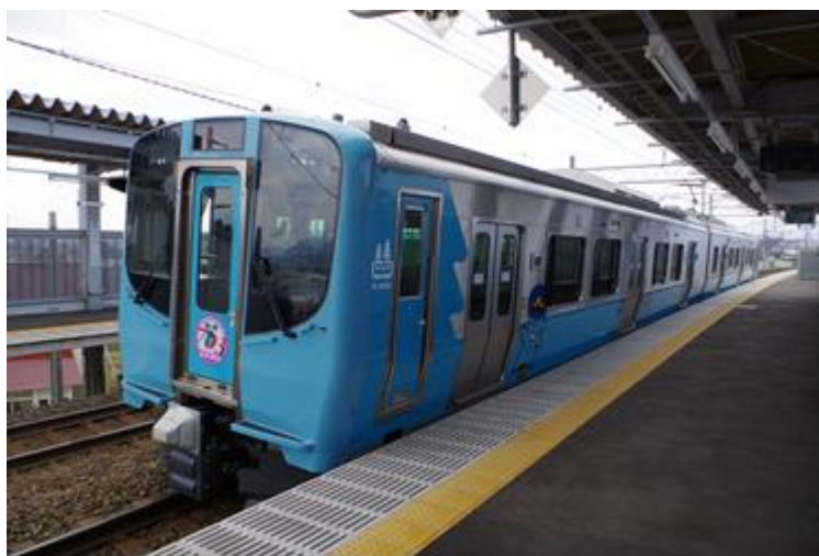
筒井駅に停車する新型車両「青い森703系」 (2014年3月15日運行開始)