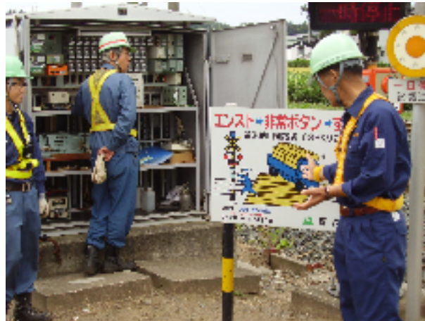
踏切事故防止訓練（平成20年9月26日）