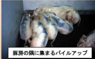
豚房の隅に集まるパイルアップ