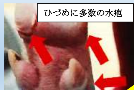
ひづめに多数の水疱