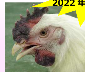
とさかと肉冠のチアノーゼ