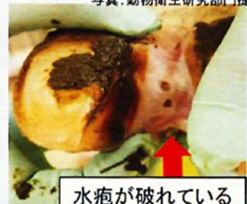
水疱が破れている