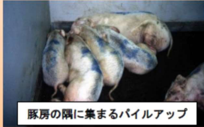
豚房の隅に集まるパイルアップ