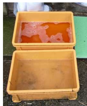
推奨される 踏込消毒槽の設置方法