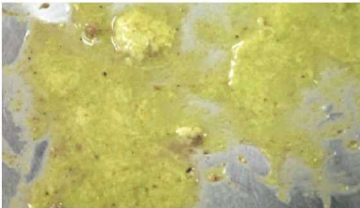
未消化固形物を含む黄色水溶性下痢