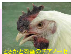
とさかと肉垂のチアノーゼ