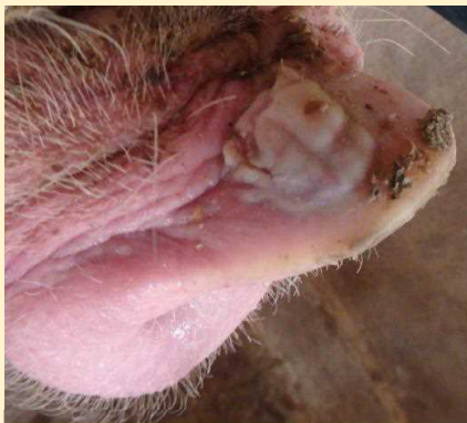
破裂した鼻の水胞

平成28年7月にアメリカのと畜場で、豚の鼻や蹄等に水泡を呈する症例が確認されました。口蹄疫は陰性であったものの、そのほとんどの症例からSeneca virus A陽性が確認されたとの情報提供がありました。本病は、これまで国内での発生はありませんが、 口蹄疫の類似疾病として注意が必要です。