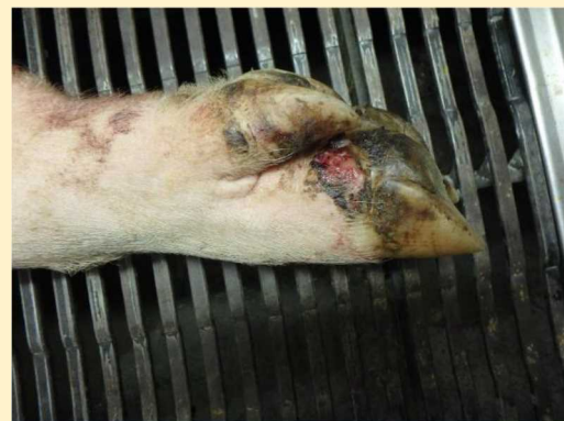
蹄冠帯の潰瘍病変