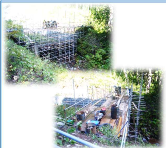
技術者及び機材の重点配置