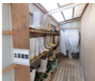
農場専用衣類・長靴の設置