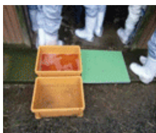
踏込消毒槽の設置