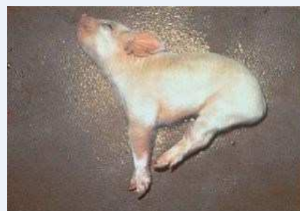
神経症状を示す発症豚

オーエスキー病ウイルスは豚・いのししに感染し、流死産、神経症状、発熱、嘔吐、下痢等により、生産性を著しく低下させます。