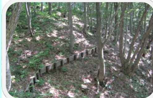
写真：間伐材を利用した丸太柵

水道水などの水源となる森林では、大雨により表面の土砂が流されてしまわないように、間伐材（間引いた木を利用した材木）を利用した丸太柵を設置しています。