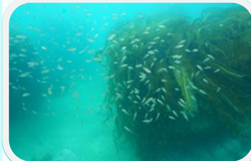
写真：ブロックに茂る海藻(八戸市)