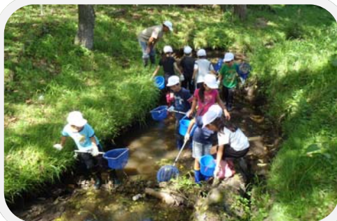
写真：水路の生物調査(八戸市)