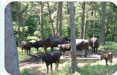
写真：林の残る牧草地(五戸町)

牧場を囲む柵には青森県産杉の間伐材を使い、県産材の利用拡大と資源の有効活用にも取り組んでいます。