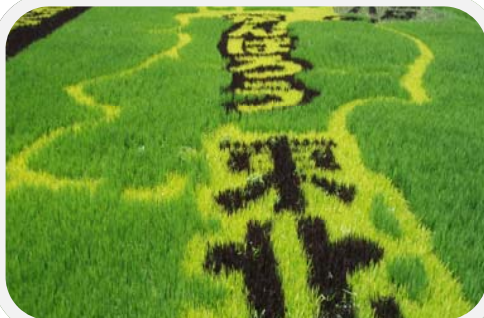
写真：田んぼアート(南部町)