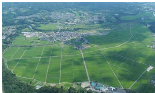
経営体育成基盤整備事業 地引地区（南部町、H23～R1）