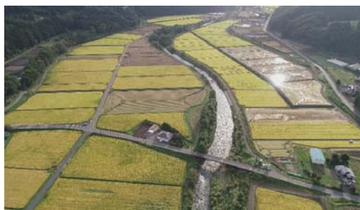
経営体育成基盤整備事業 原・飯豊地区（田子町、H23～H28）