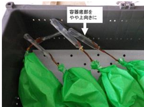
貯蔵コンテナによる保管