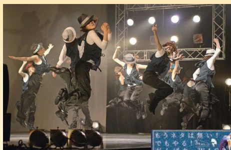
☞ 観客の目線に立ち、「何をされたら面白いか」を常に考え演出に生かしているという。