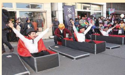
2015年ドラキュラフェスタの一場面。幅広い年齢層の住民が仮装しており、町全体での盛り上がり伝わってくる。