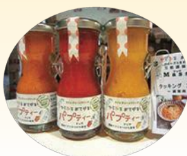
ドラキュラのネットワークを活用して開発されたポルトガルの伝統調味料「パプティーマッサ(マッサ)」