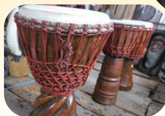
👉 自作の火起こしキットで火起こしを披露してくれた。 👉 スギで自作した「ジャンベ」。 2018年から楽器づくりのワークショップ開催を予定している。