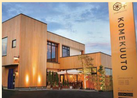
「お米のテーマパーク」KOMEKUUTO八戸店。イトインスペースや、米ぬかを使ったふりかけなどのオリジナル商品を取り揃えているセレクトショップを併設している。2階にはダンススタジオも。