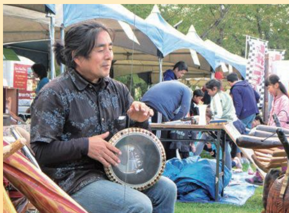
👉 地域のイベントにて手作りの楽器を演奏、魅力を伝えている。

中で子どもたちに創造性・感受性・自主性を育むような体験を提供するものだ。講座内容はたき火体験や、木を利用したブランコ、アスレチック、ベンチ、ツリーハウス作りなど、モノづくりの楽しさや自然への親しみを感じられるものとなっている。