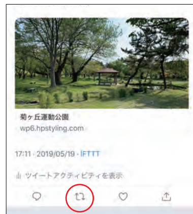
Twitter リツイートボタン