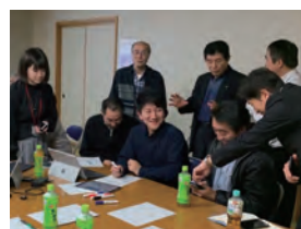
平内町ワークショップ