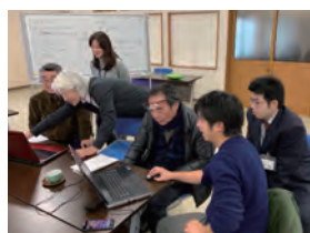
今別町ワークショップ