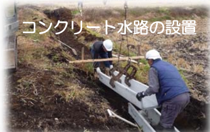
コンクリート水路の設置

【支援する活動内容】 土水路へのコンクリート水路の設置や耕作道路の砂利補修、勾配が急な道路へのコンクリート舗装などの簡易な施工を、農家・地域住民等の手で行う。