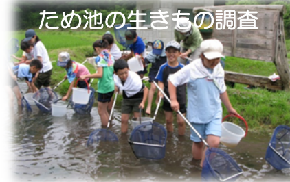
ため池の生きもの調査

【支援する活動内容】 農業用水路やため池などに生息する動植物の観察会や生きもの調査を行うことで地域の自然環境の大切さを学ぶ。