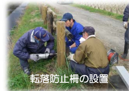
転落防止柵の設置

【支援する活動内容】 農業用水路脇やため池周辺への転落防止柵設置などの簡易な施工を、農家・地域住民等の手で行う。