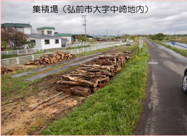
集積場（弘前市大字中崎地内）

伐採木の処分には、多くの予算を要します。このため、発生した伐採木を希望者に提供することで有効利用によるコスト削減を図っています。希望者は申請書の提出が必要となりますので、中南地域県民局地域整備部にご連絡ください。 連絡先：河川砂防施設課 0172-34-1283