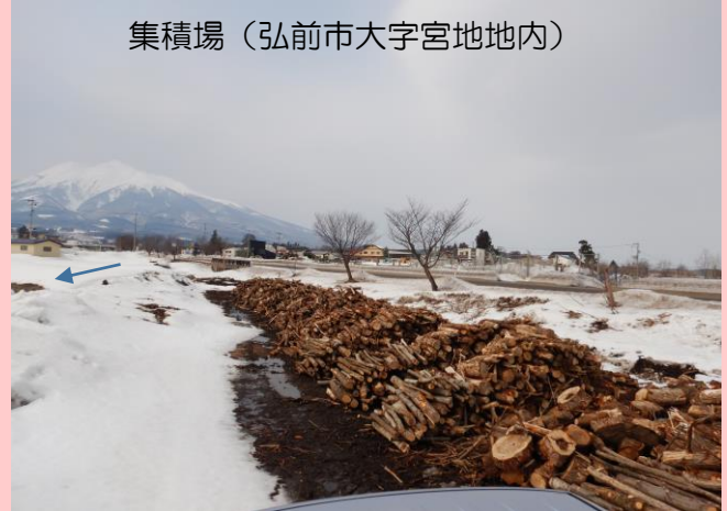
集積場（弘前市大字宮地地内）