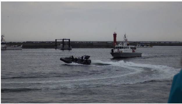
〈テロリストの追跡〉