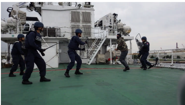
〈テロリスト捕捉訓練〉