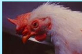
顔面の浮腫性腫脹