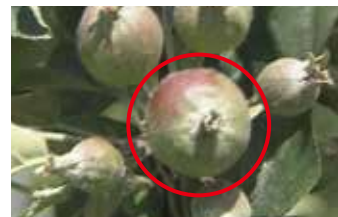
発育の良い中心果