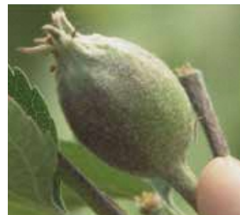
障害果(つるが短い)