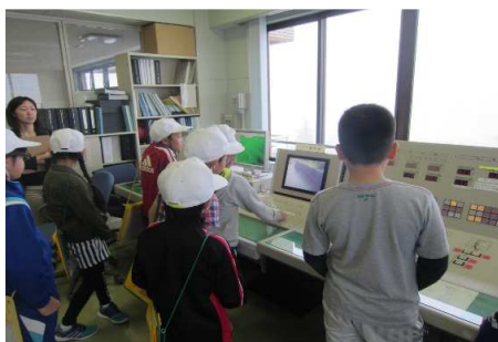
カメラ操作は長蛇の列 将来はダムの管理者？