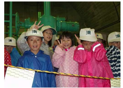
水力発電設備の見学 大音量にビックリ！