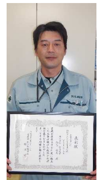
表彰状 ～主任技術者～

( http://www.pref.aomori.lg.jp/soshiki/kenmin/ao-kendo/youyoukoujihyoushou.html )