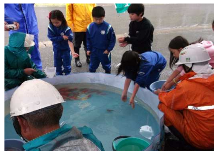
鯉の放流体験 池に放す予定でしたが・・・