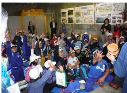
ひばの丸太切りコースターが大人気！ 急遽ジャンケン大会となりました