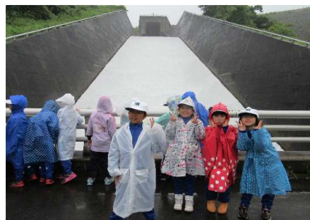
洪水吐の見学 滑ってみた〜い！との声も