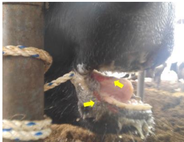
泡沫性流涎と舌や口唇のびらん