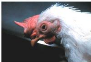
顔面の浮腫・腫脹