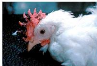
肉冠の出血・壊死