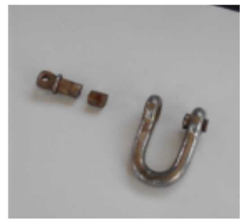
吊り金具破損部詳細