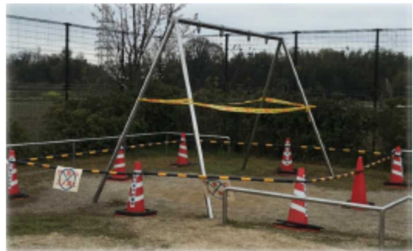
遊具使用禁止措置状況