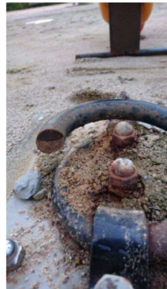
根本破断状況（拡大）