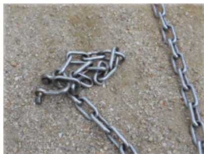
吊り金具破損状況