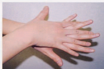
2. 手の甲を伸ばすように洗う