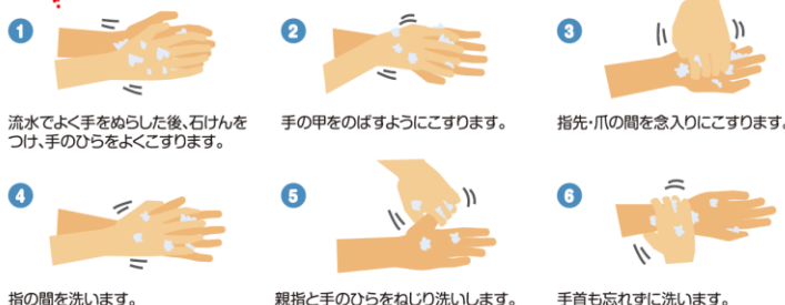
図 厚生労働省リーフレットより抜粋