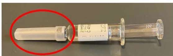
針ありシリンジ製品（現行品）