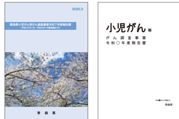
〈パンフレット等イメージ〉

当パンフレットのPDFデータのほか、 青森県小児がん等がん調査事業報告書 （詳細版）は、青森県庁ホームページ で公開しています