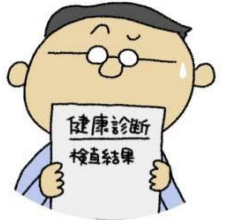
青森県健やか力向上推進キャラクター 「マモルさん」

健康診断の結果、糖代謝(血糖、HbA1c)の項目が「要精検」、「要治療」 になった方は、早めに医療機関で再検査を受けましょう。