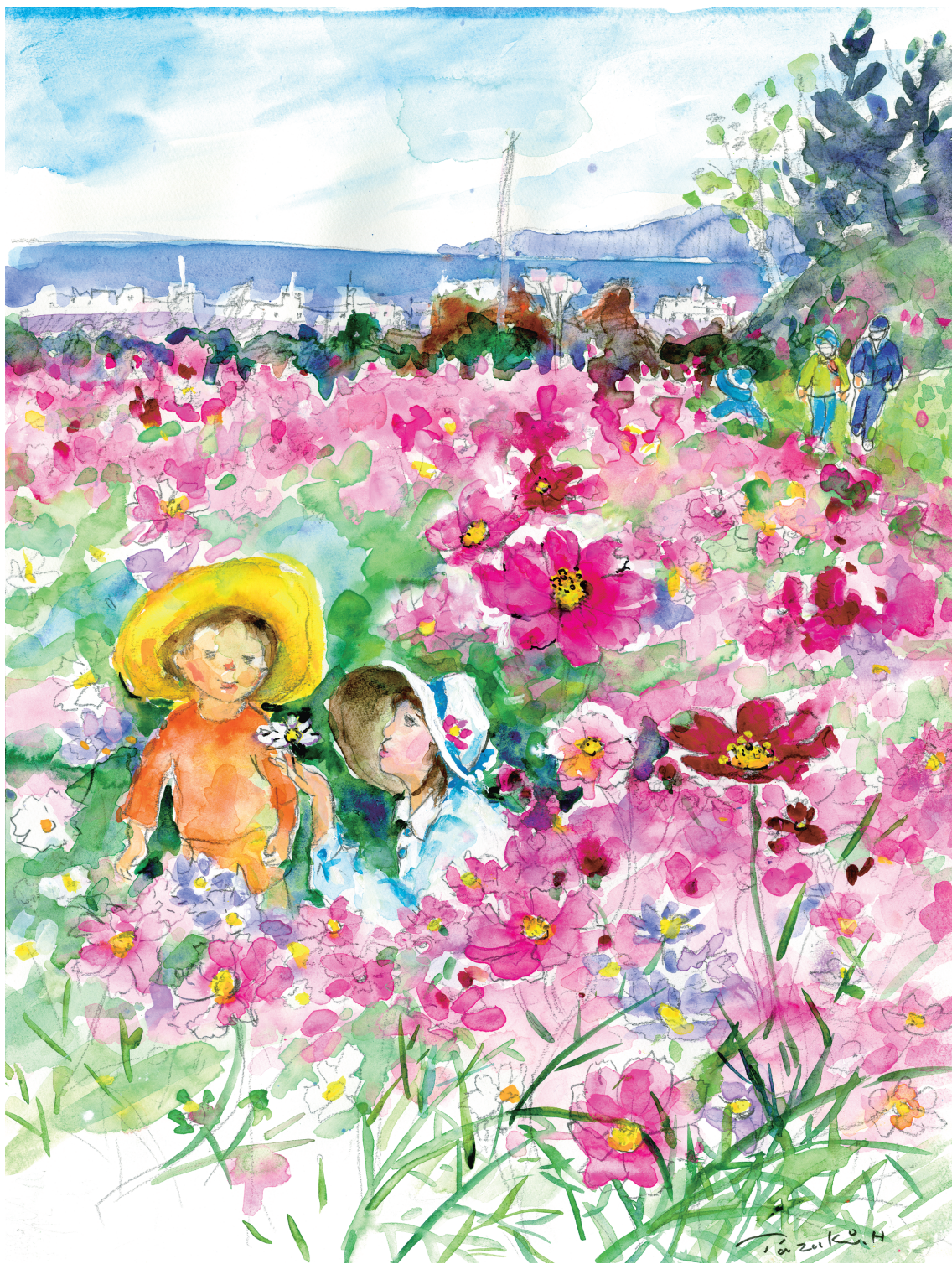
秋桜咲く頃（岩手県） 張山田鶴子 画