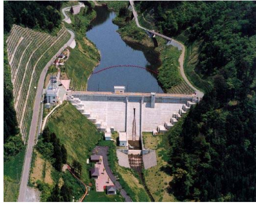
【小泊ダム地点雨量】