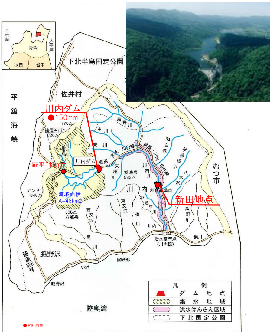
【川内ダム地点雨量】