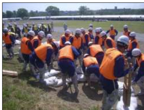
水防訓練の状況（八戸市 馬淵川）