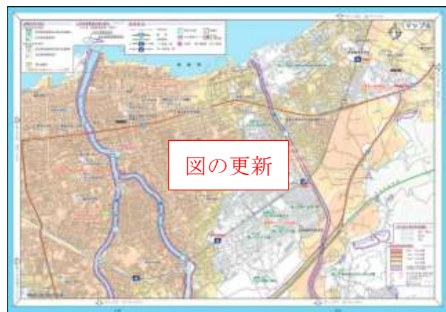
洪水ハザードマップ (青森市 堤川・駒込川)