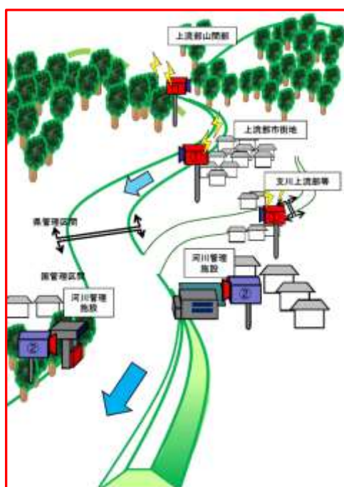
簡易型河川監視用カメライメージ