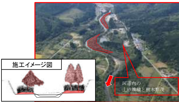
樹木伐採・河床掘削イメージ