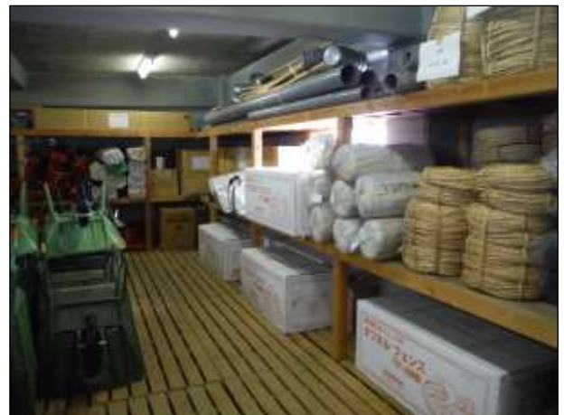
県水防倉庫内備蓄状況（青森市 桜川）