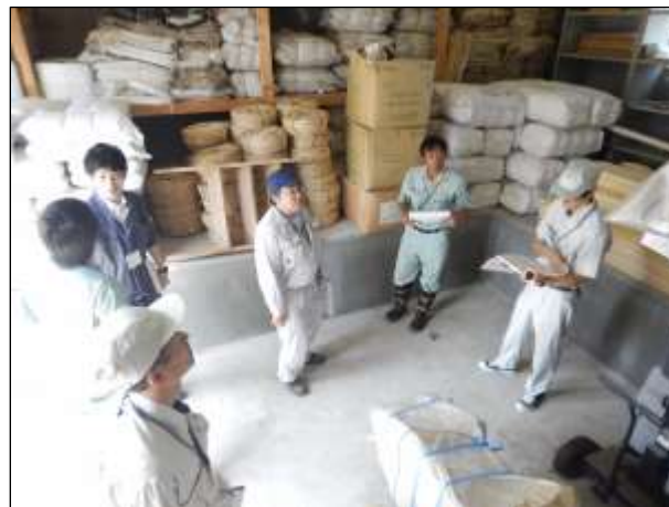
県水防倉庫合同巡視状況（青森市 桜川）