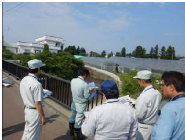
合同巡視状況（青森市 合子沢川 新横内橋）