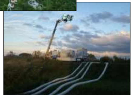
二ツ森橋下流での排水活動（東北町 H18 出水）