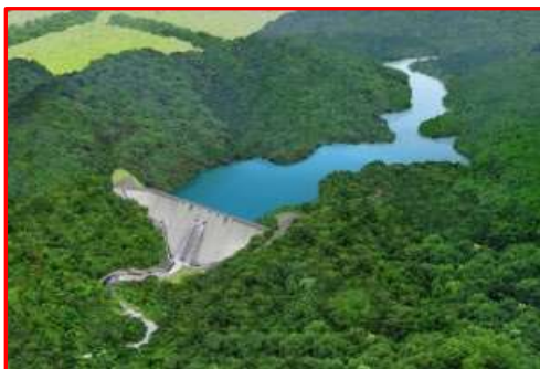
駒込ダム完成イメージ