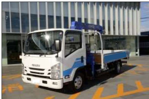
資機材運搬用トラック