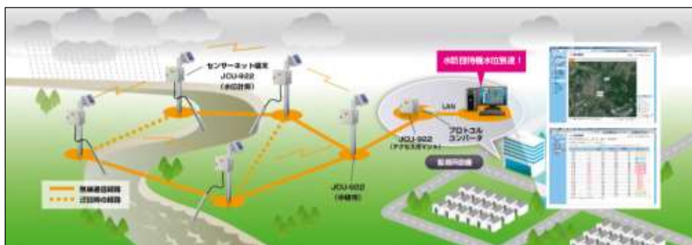
危機管理型水位計ネットワークイメージ