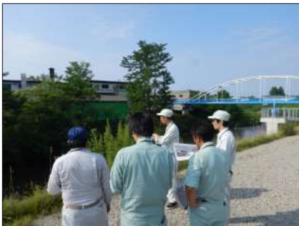
合同巡視状況（青森市 堤川 牛館川合流点付近）