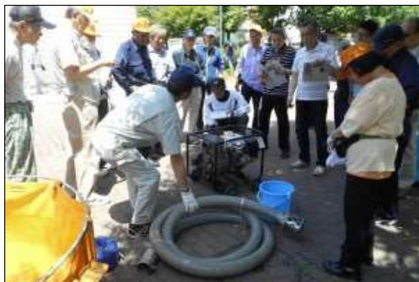
資機材点検の状況