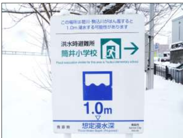
看板設置状況 (青森市 堤川・駒込川)