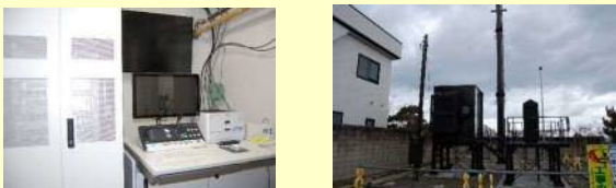
整備が完了した親卓及び中継局舎