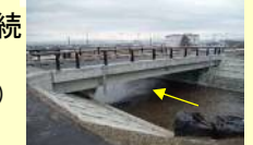
【天田内川】県審橋付近（R1施工箇所）