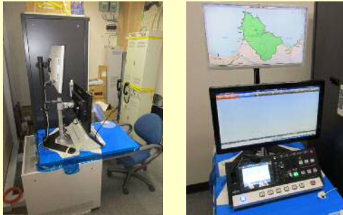
平内町役場内の基地局設備