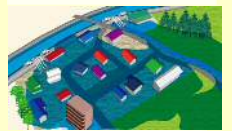
緊急排水状況のイメージ