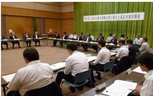
第2回 減災対策協議会開催状況 (平成28年8月29日)