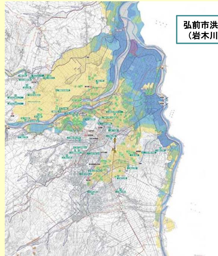
弘前市洪水ハザードマップ (岩木川右岸)