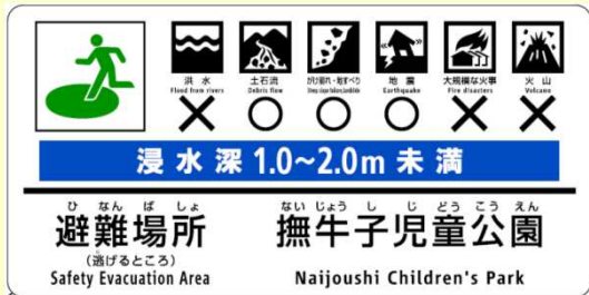
指定緊急避難場所の看板設置 (5箇所)