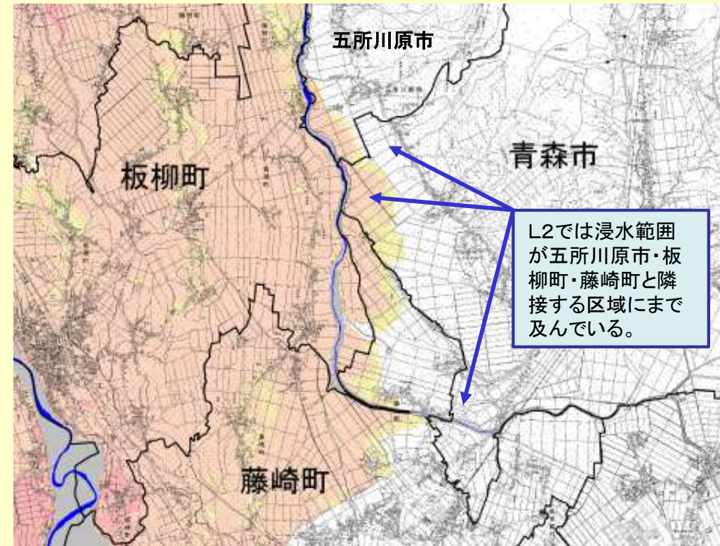
岩木川水系岩木川洪水浸水想定区域図（想定最大規模）