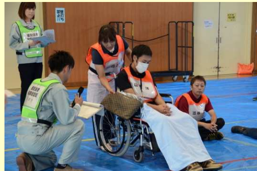
福祉避難所の開設訓練 (H28市総合防災訓練)