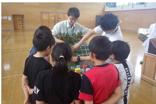
砂防模型を楽しむ児童たち

今年度は7月5日（金）に弘前市立大和沢小学校 おおわさわ で開催し、砂防模型と土石流・火砕流の二オイのサンプルを使用し、砂防施設と土砂災害について楽しみながら理解を深めていました。