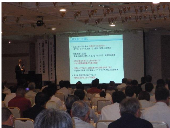
おおの 大野 ひろゆき 宏之氏の講演