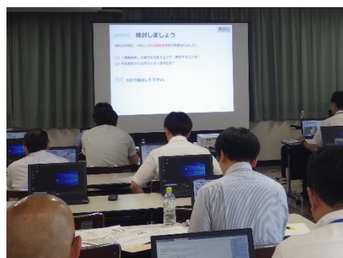
シミュレーション演習を行う参加者