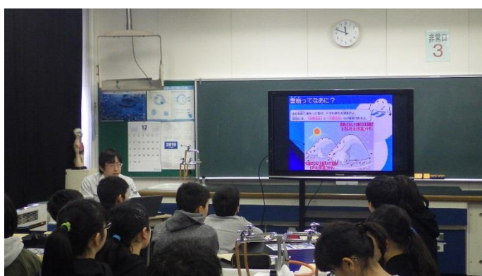
雪崩防災資料を用いた説明