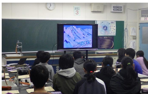
雪崩防災ビデオに集中する児童

児童代表から「身近に雪崩危険箇所があることが分かった。雪崩が起きる前兆を見つけたら注意したい。」との感想をいただきました。