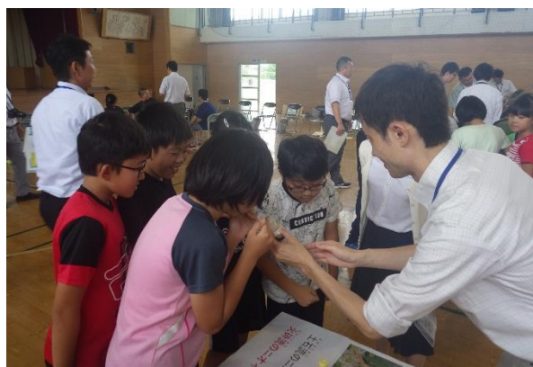
土石流・火砕流の二オイをかぐ児童たち