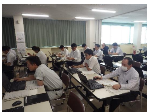
真剣な表情で臨む参加者