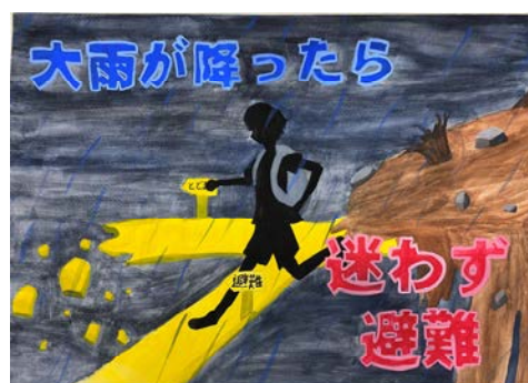
↑中学生絵画の部 青森県最優秀賞