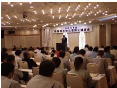
令和元年度の土砂災害防止講演会開催状況

また、川の防災と土砂災害に対する知識の習得及び防災意識の向上を図る目的で、小学生を対象とした「川の防災安全教室」を平成 26 年度より開催しています。土砂災害の種類や発生メカニズム、それらに対する具体的な対策を模型や映像を用いて分かり易く説明し、「自分たちが住む地域ではどこが危険か」等、地域の実状を具体的に知ってもらう取組を進めています。今年度はむつ市脇野沢小学校で開催予定です。