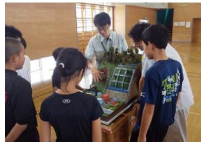
「川の防災安全教室」弘前市立大和沢小学校