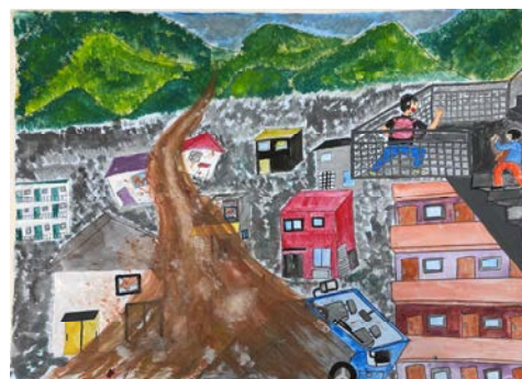
↑小学生絵画の部 青森県最優秀賞