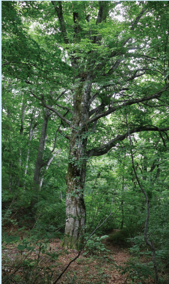
西目屋村 マザーツリー後継「白神いざないツリー」