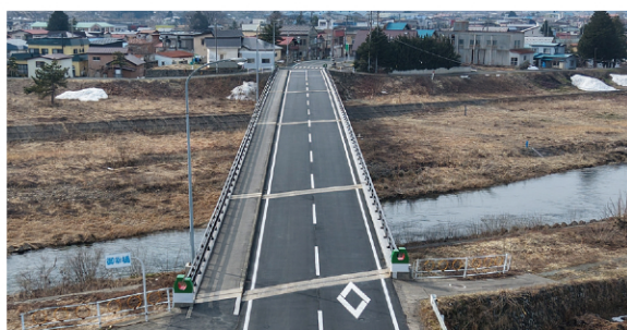
橋梁補修事業 （石川百田線・弘前市石川【御幸橋】：令和8年3月完成）