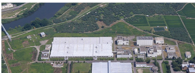
岩木川浄化センター

令和8年度は、岩木川浄化センター及び各中継ポンプ場の設備更新工事・修繕工事の他、下水汚泥を肥料化する施設の運営を開始します。