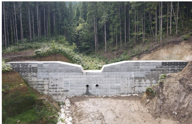
北羽黒沢通常砂防事業

事業実施に当たっては防災対策と合わせて、周辺景観や地域整備に調和した豊かな水辺づくりを実施するなど、環境の保全を図りながら進めることとしています。