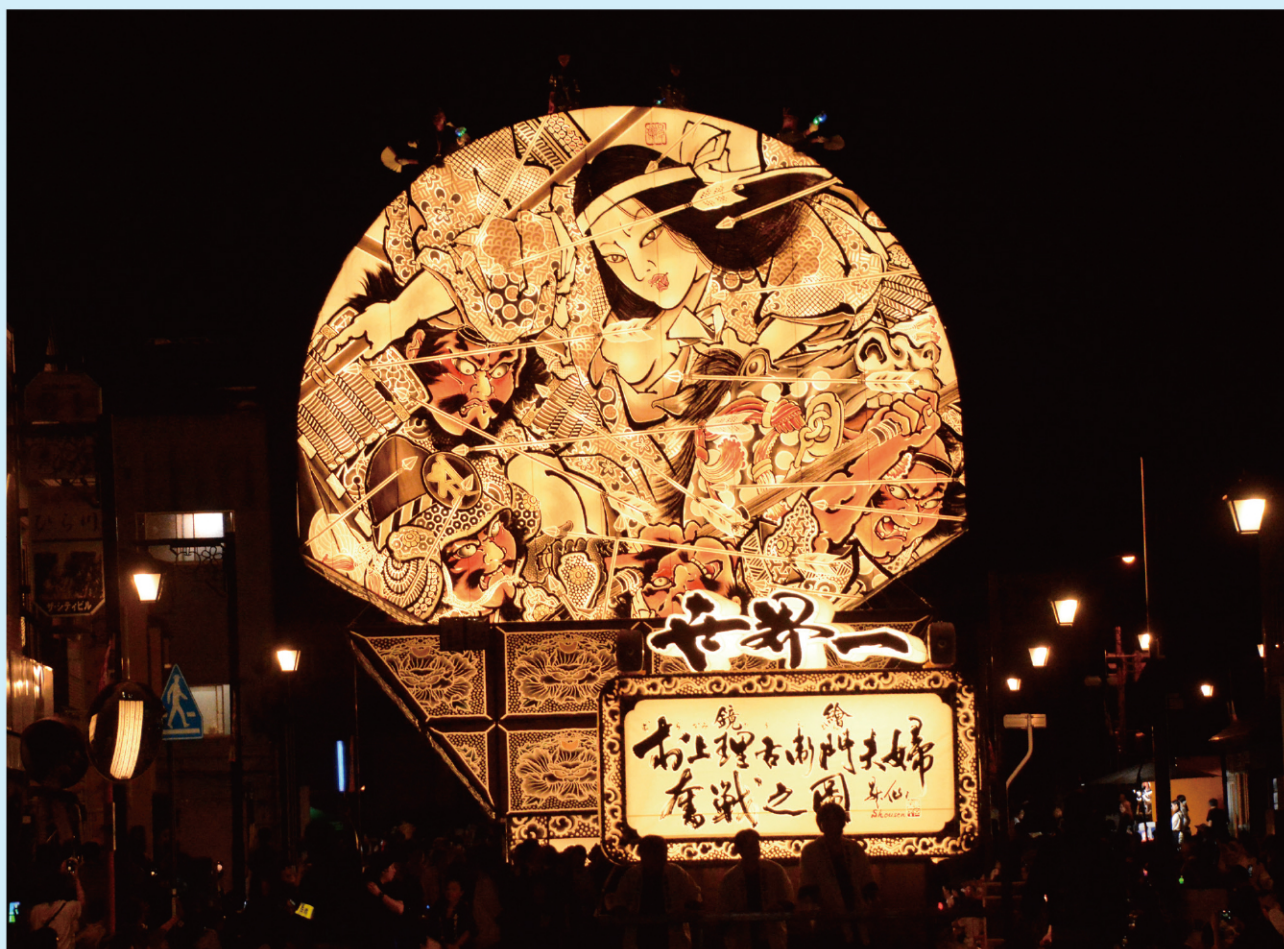
平川市「世界一の扇ねぶた」