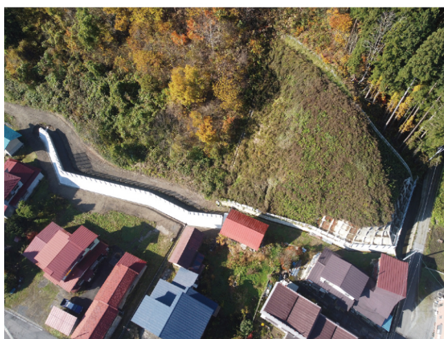
虹貝新田区域急傾斜地崩壊対策事業

災害を未然に防止し、地域住民の生命・財産等を守るため、施設の整備及び維持管理に努めています。