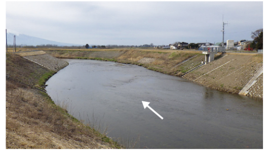
平川広域河川改修事業（弘座川工区）