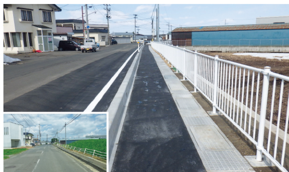
交通安全事業（側溝整備） （松木平撫牛子線・弘前市小比内5丁目：令和8年3月完成）

また、橋が老朽化してから架け替えをするのではなく、定期点検を行い、計画的に補修することで長寿命化を図る橋梁アセットマネジメント事業を実施し、橋梁の適切な維持管理・保全に努めています。