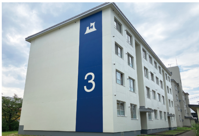
県営住宅 茂森団地

また公営住宅法に基づく県営住宅を管内に9団地（約1,200戸）整備しており、計画的に維持修繕工事を行っています。