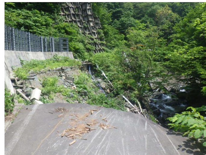
△被災箇所の現状（令和7年7月撮影）