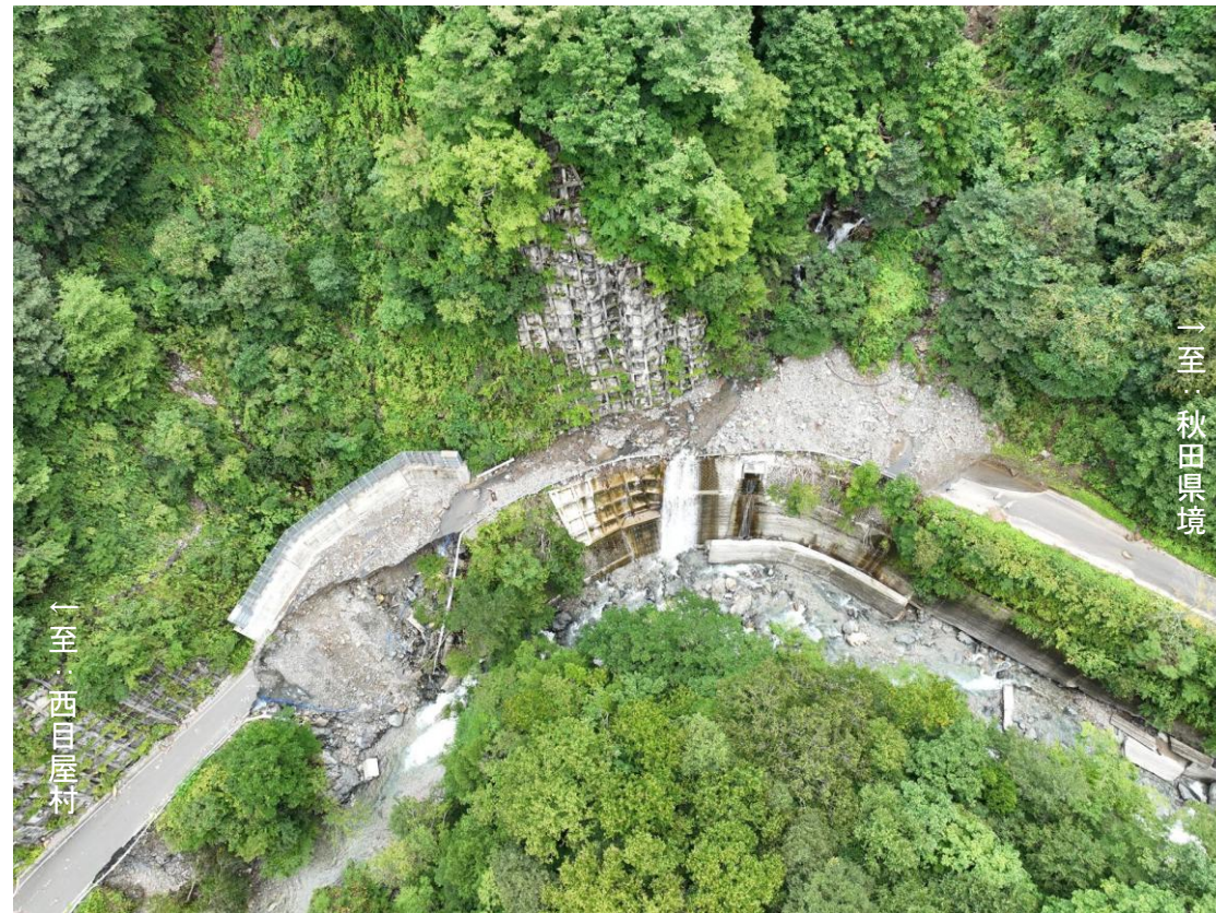
△被災箇所上空全景（令和4年9月撮影）