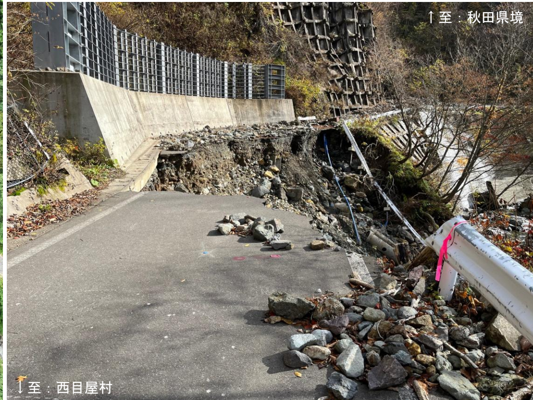
△被災時の状況（令和4年11月撮影） 「道路全体が崩落」